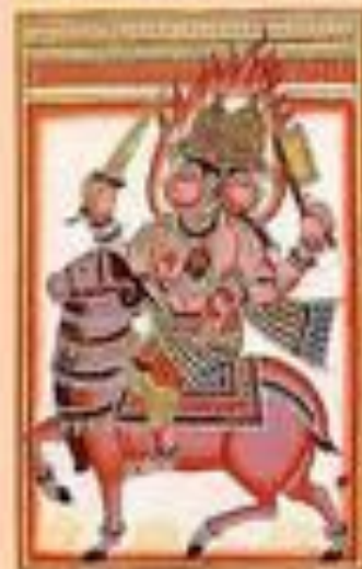
Агни – бог огня