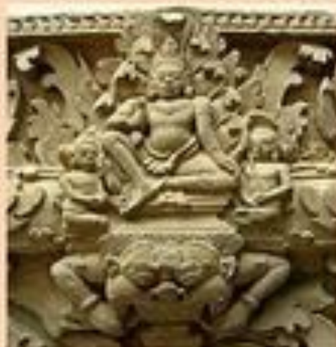
Индра- бог грозы, воитель