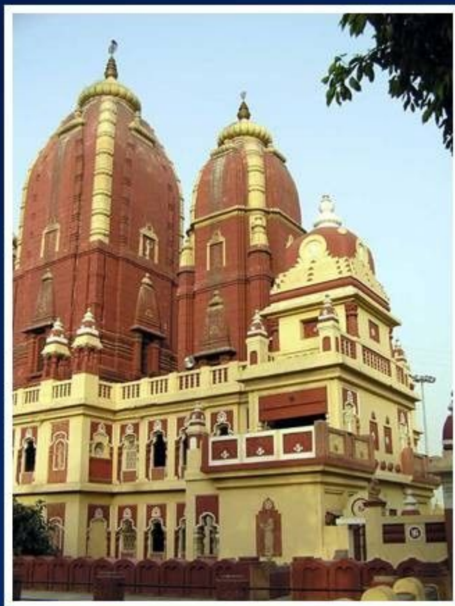
Индуистский храм в Дели