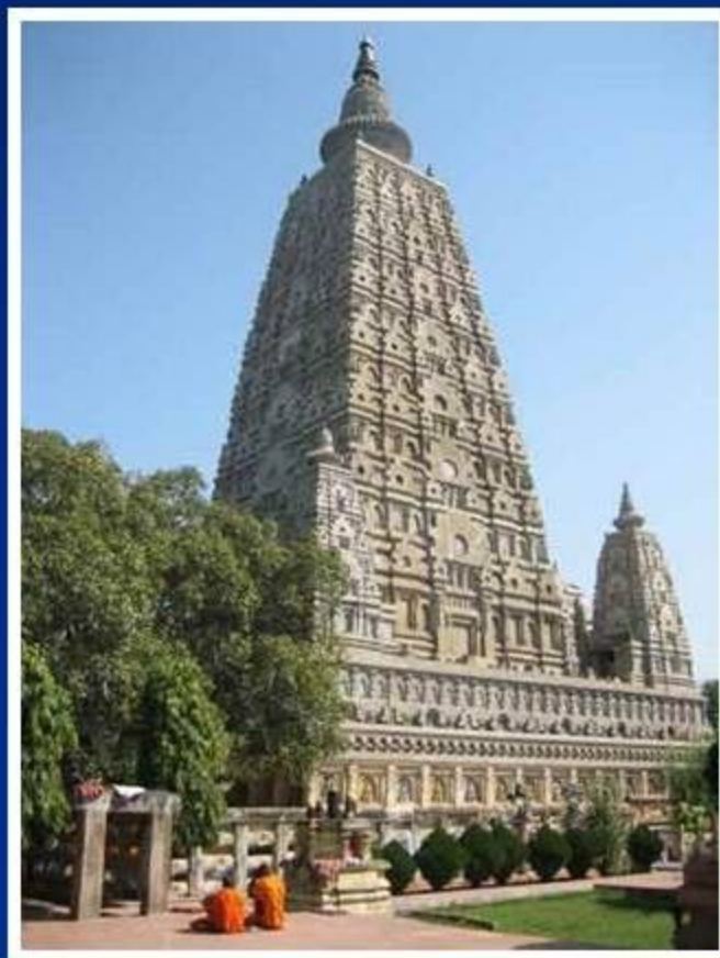
Место, где в V веке до н. э. Гаутама достиг просветления и стал Буддой.