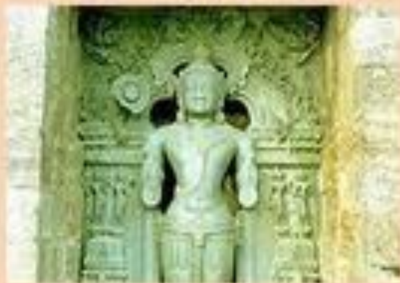
Сурья- бог солнца