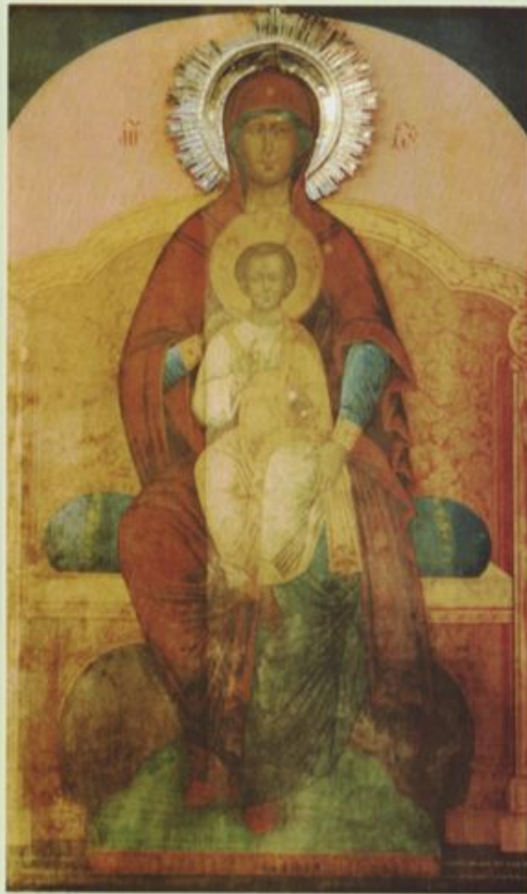
◆ Печерский образ Божией Матери. 1829 год Воскресенский собор