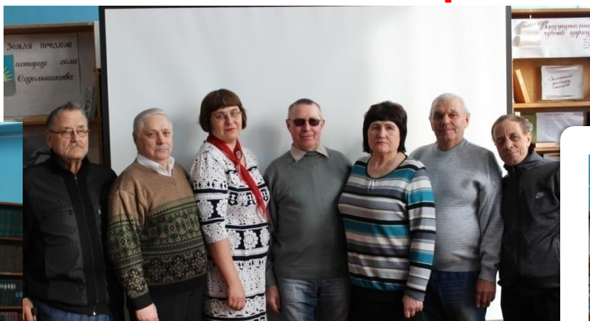
«Отчизны славные сыны»