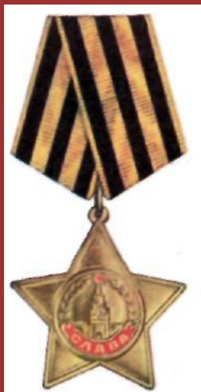
Орден Славы 1-й, 2-й и 3-й степени

В разгар наступательных боев Советской Армии 8 ноября 1943 г. были учреждены еще два ордена — орден «Победа» и орден Славы.