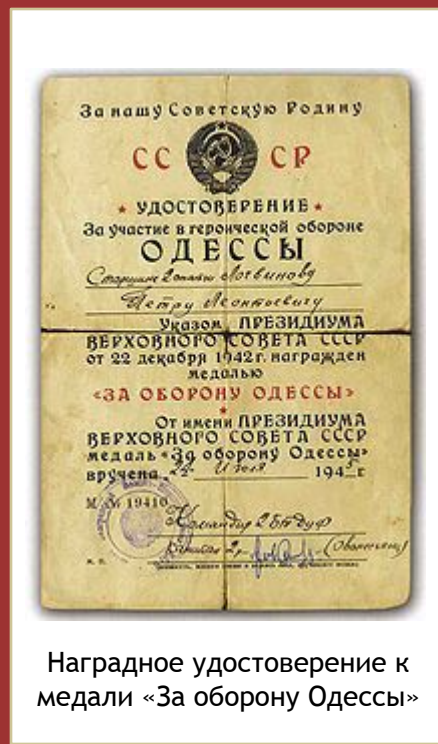
Наградное удостоверение к медали «За оборону Одессы»