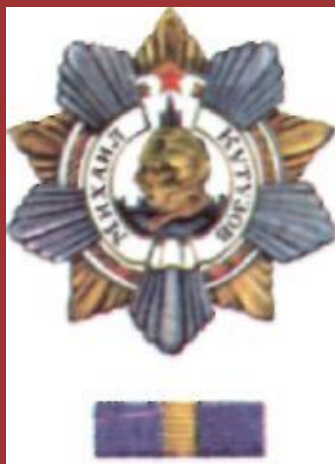
Орден Кутузова 1-й и 2-й степени