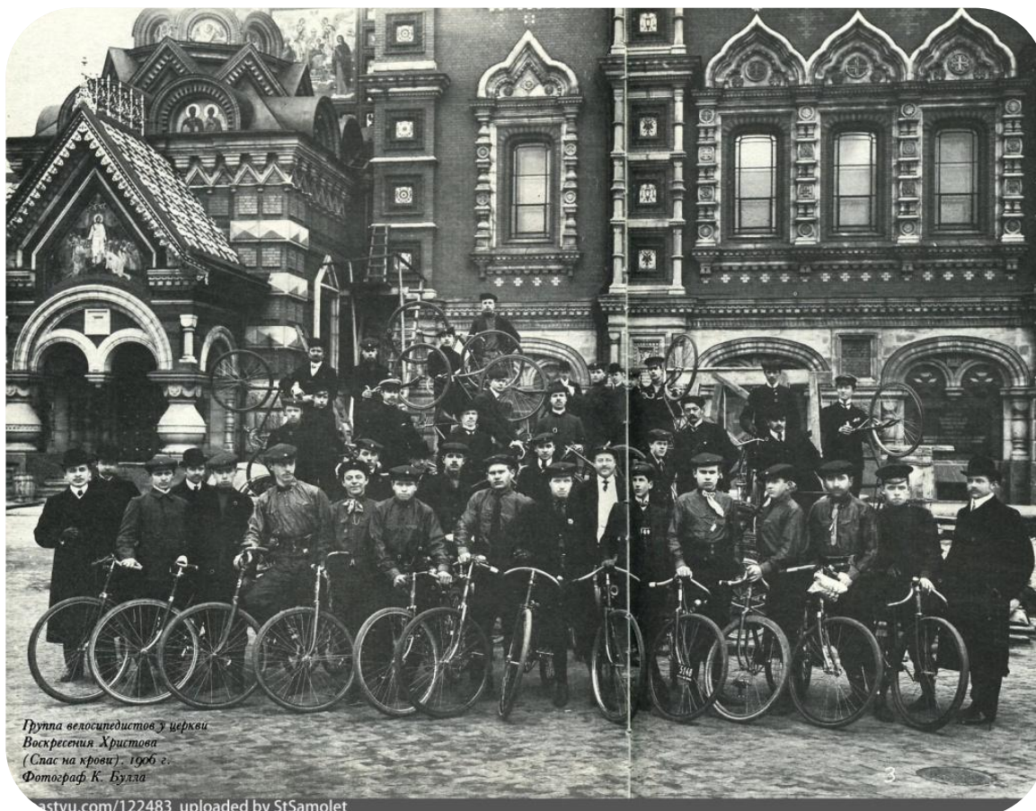
Группа велосипедистов у церкви Воскресения Христова (Спас на крови). 1906 г.

Созданное в 1900 г. в Санкт-Петербурге Русское горное общество строило туристские приюты, разрабатывало маршруты, способствуя пропаганде и развитию туризма в России