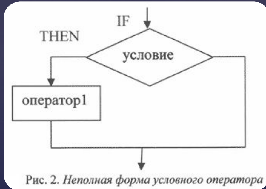
Рис. 2. Неполная форма условного оператора