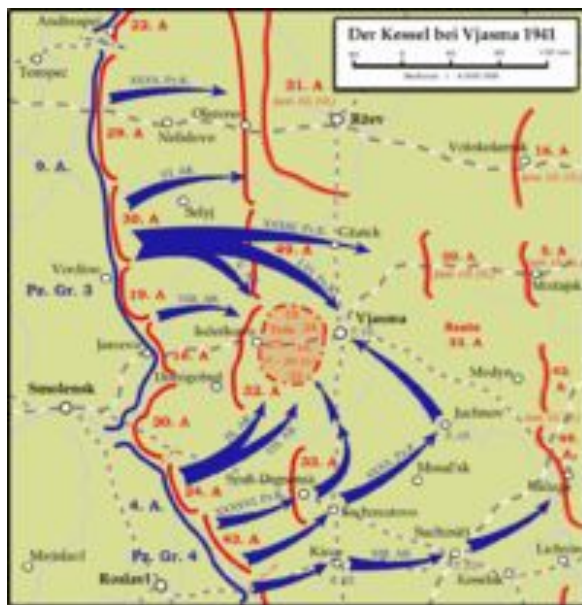
Вяземский «котёл» в октябре 1941 года.

Было две попытки захвата столицы немецкими армиями