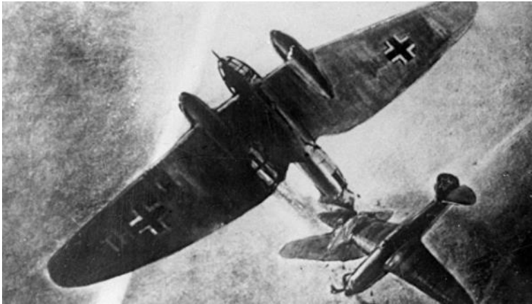
Воздушный таран. Реконструкция

Красной Армии В первый день войны тараны совершили около 20 военных летчиков