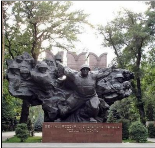
Памятник двадцати восьми панфиловцам в Алмат-Аты

( 16 ноября) особо отличилась 316-я стрелковая дивизия под командованием генерала И.В. Панфилова , отразившая несколько танковых атак противника и остановившая продвижение танков к Москве