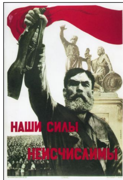
"Наши силы неисчислимы (В. Б. Корецкий)