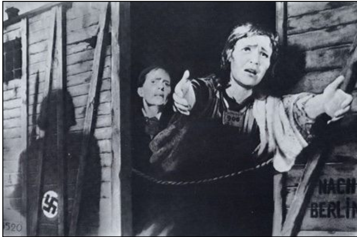
Плакат «Воин Красной Армии, спаси нас от фашистского рабства!» Корецкий В.Б.