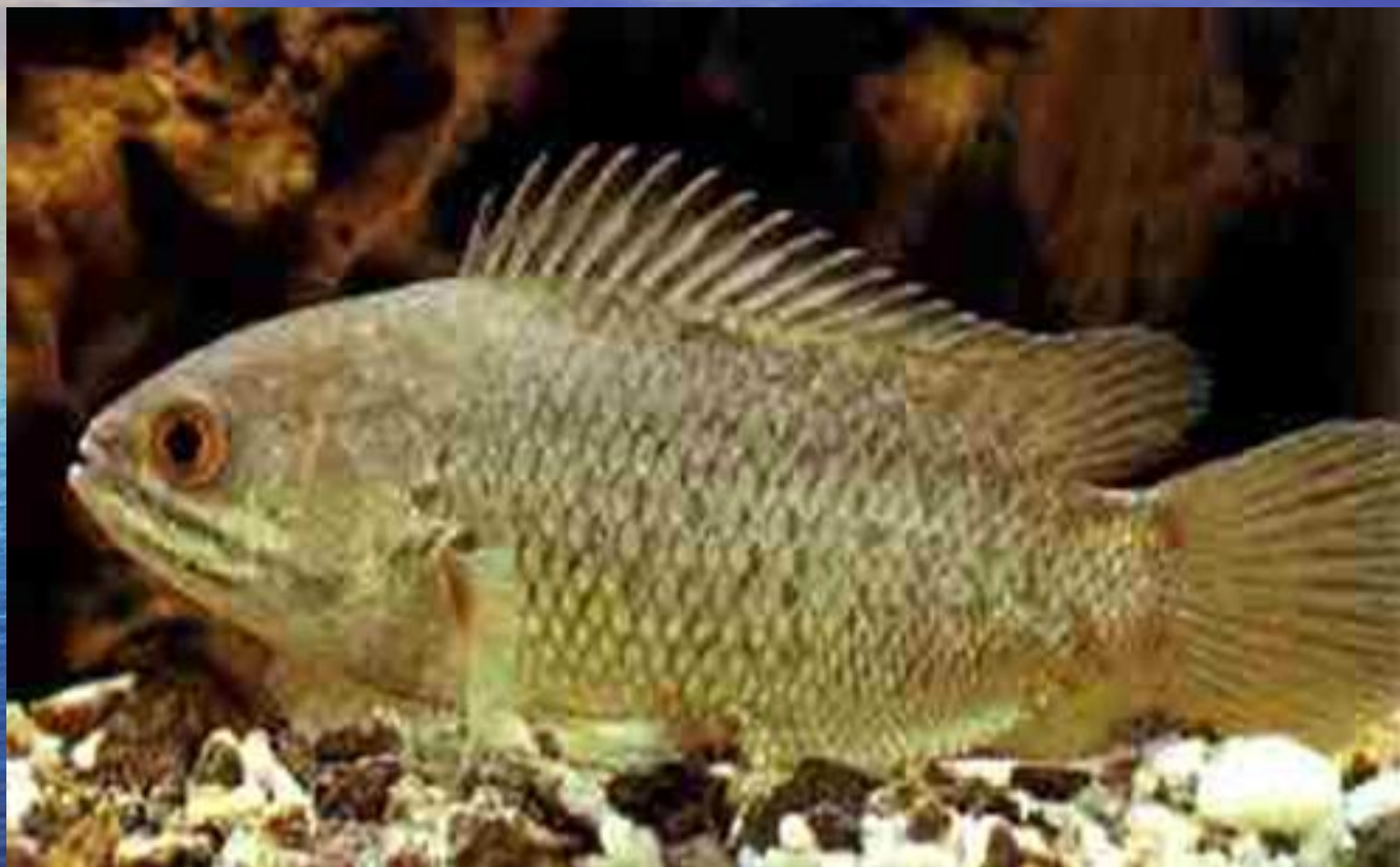
Анабас, или рыба-ползун.