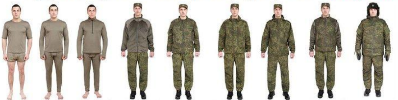
1 уровень 2 уровень 3 уровень 4 уровень 5 уровень 6 уровень 7 уровень 8 уровень