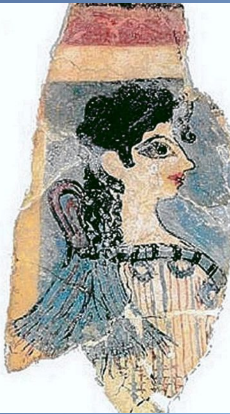
Рис. 4 «Парижанка». Фреска Кносского дворца на о. Крит