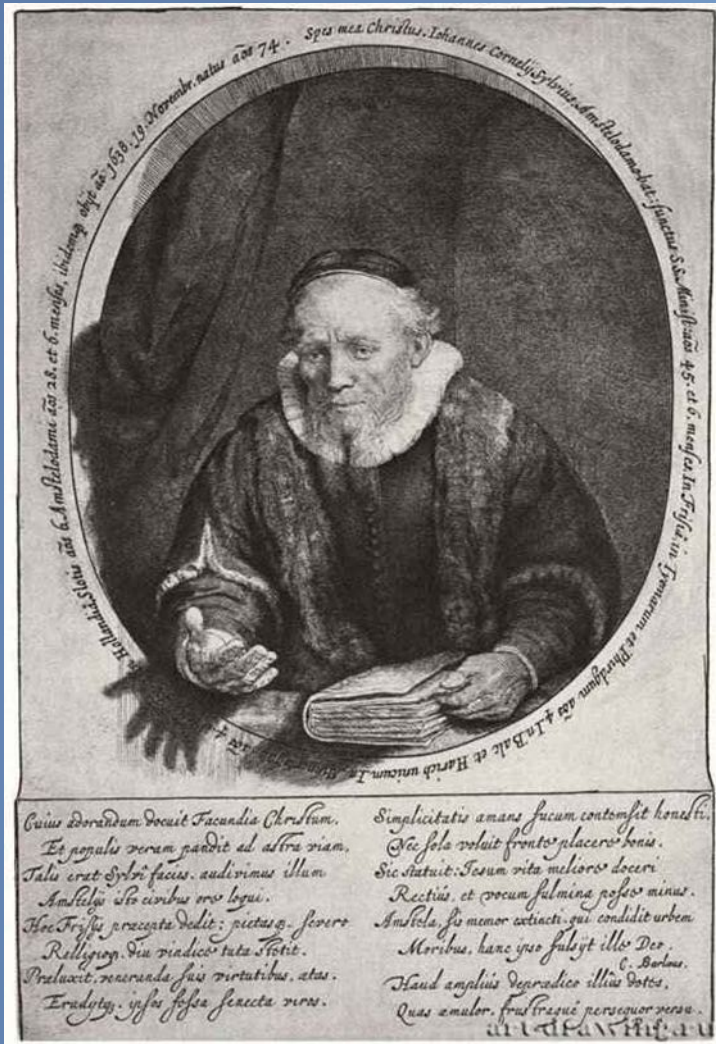
Рис. 10. Портрет Яна Корнелиса Сильвия (Сильвиуса). 1646 — Офорт Собрание Я. де Брёйна