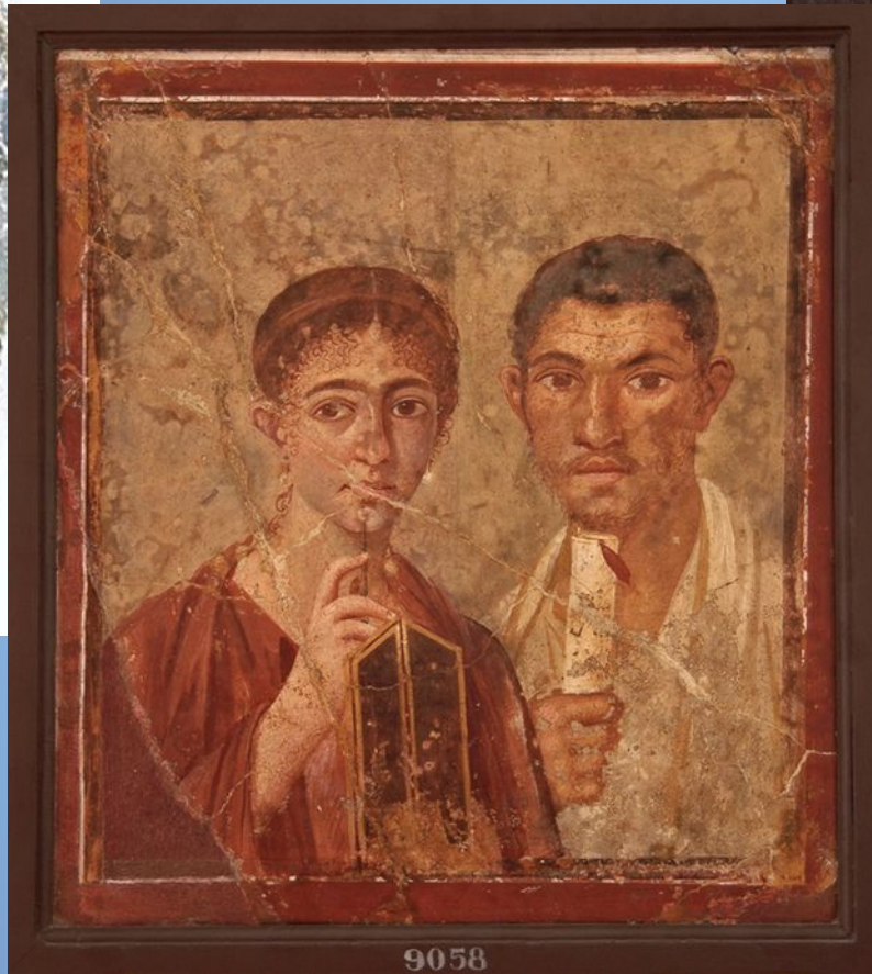
Рис. 5 «Портрет пекаря Теренция Неона и его жены. Фреска из Помпей Неаполь, Национальный археологический музей