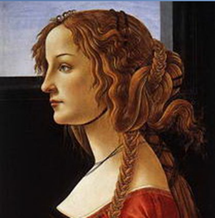
Рис. 7. Портрет Симонетты Веспуччи, 1480. Государственный музей, Берлин