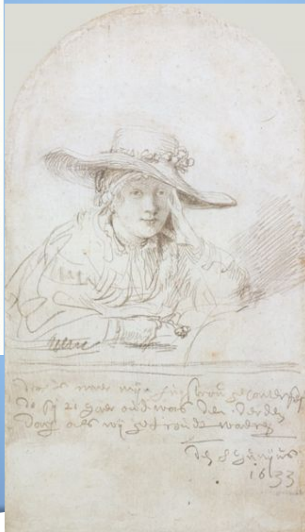
Рис. 11. Портрет Саскии. 1633г. выполнен серебряным карандашом