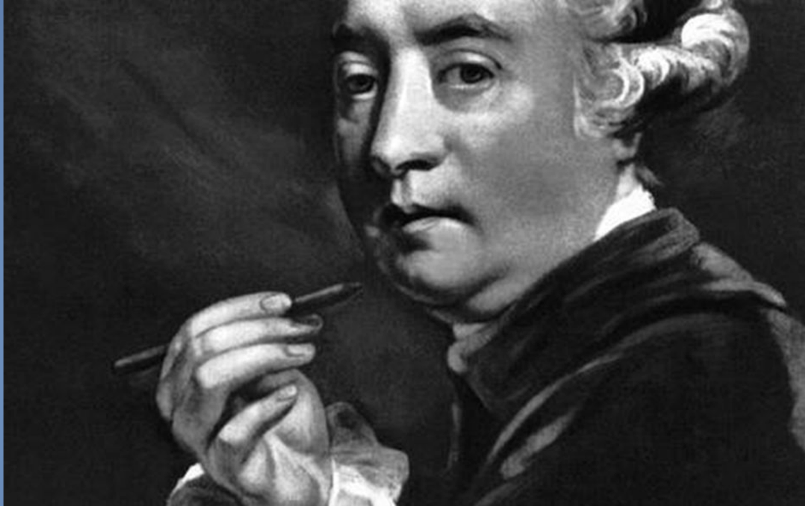
Рис.12. Меццо-тинто (Дж. Р. Смит. Групповой портрет Ф. Бартолоцци, А. Карлини и Дж. Б. Чиприани. 1778. Фрагмент).