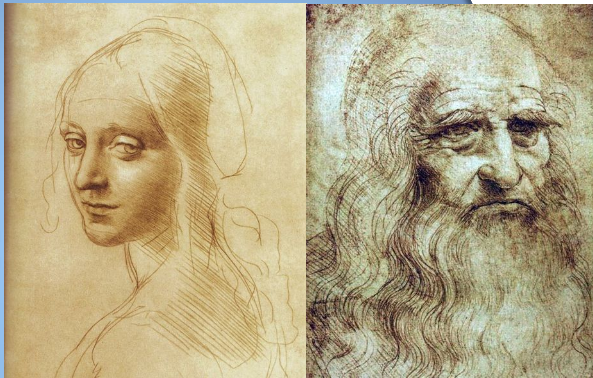
Рис. 8. Рисунки. Леонардо Да Винчи