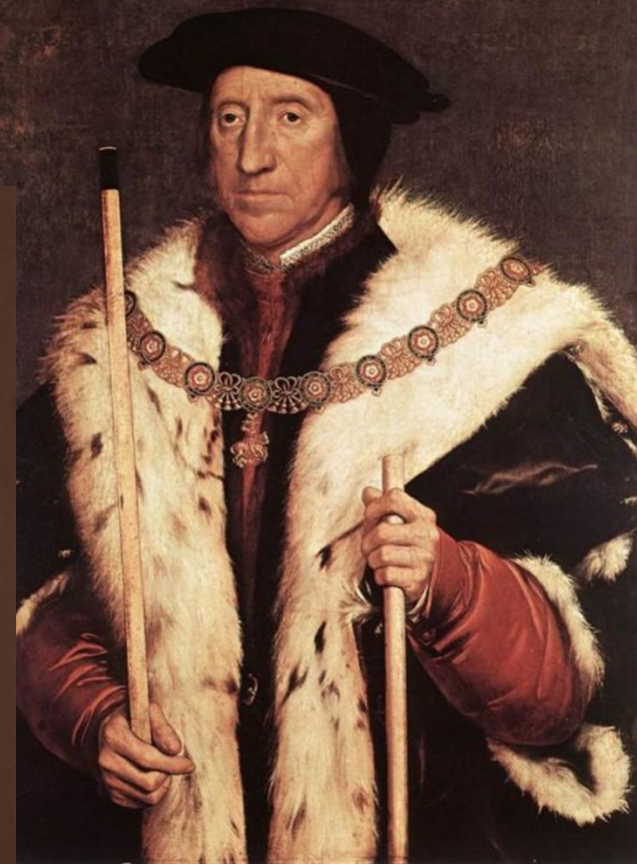
Рис. 6. Гольбейн Ганс Младший Портрет Томаса Говарда, герцога Норфолка (1539 - 1540)