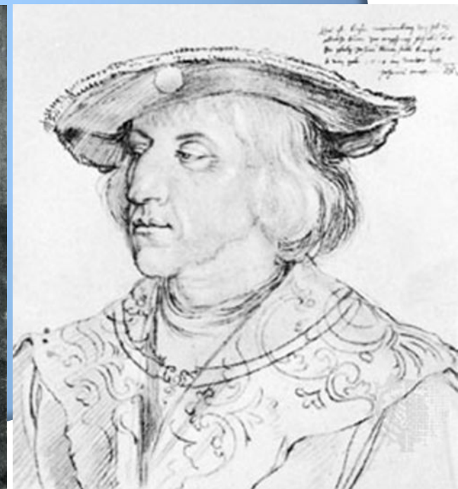
Рис. 9. Рисунки. Альбрехта Дюрера