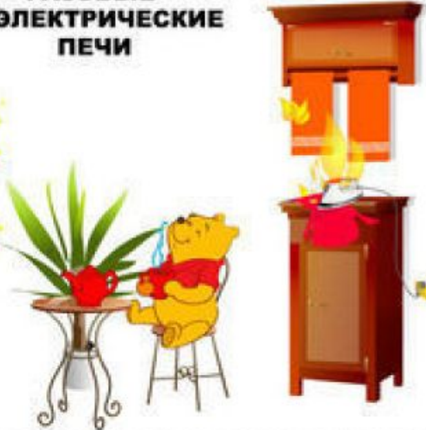
ОСТАВЛЕННЫЕ БЕЗ ПРИСМОТРА ЭЛЕКТРОПРИБОРЫ