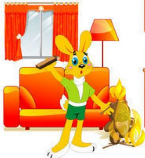
НЕОСТОРОЖНОЕ ОБРАЩЕНИЕ С ОГНЁМ