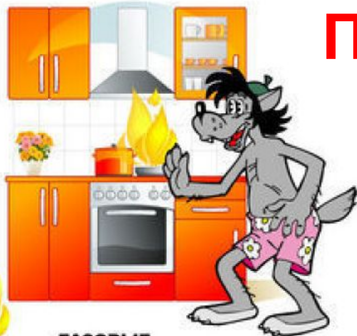
ГАЗОВЫЕ И ЭЛЕКТРИЧЕСКИЕ ПЕЧИ