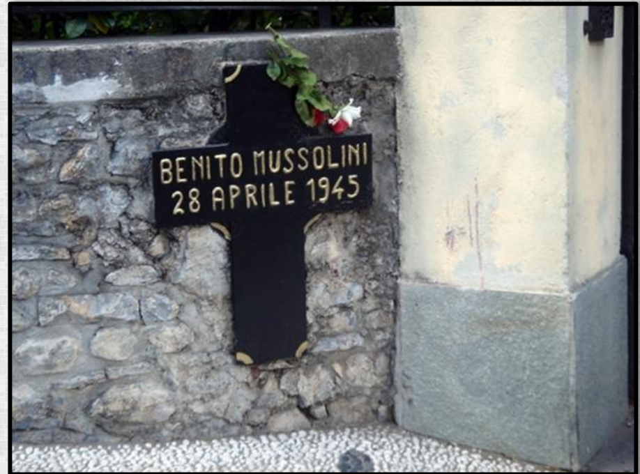
Пам'ятний знак на місці розстрілу Муссоліні