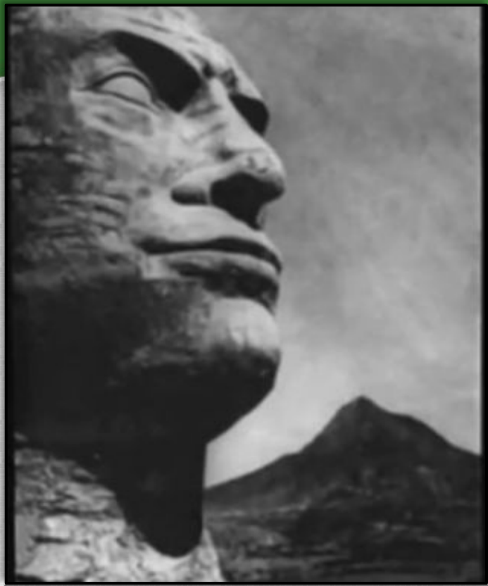
Зображення Муссоліні у вигляді сфінкса, створене солдатами після перемоги в Ефіопії