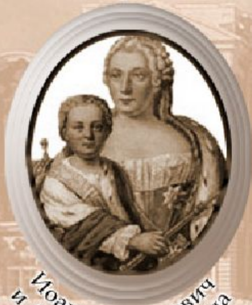
Иоанн Антонович и Анна Леопольдовна