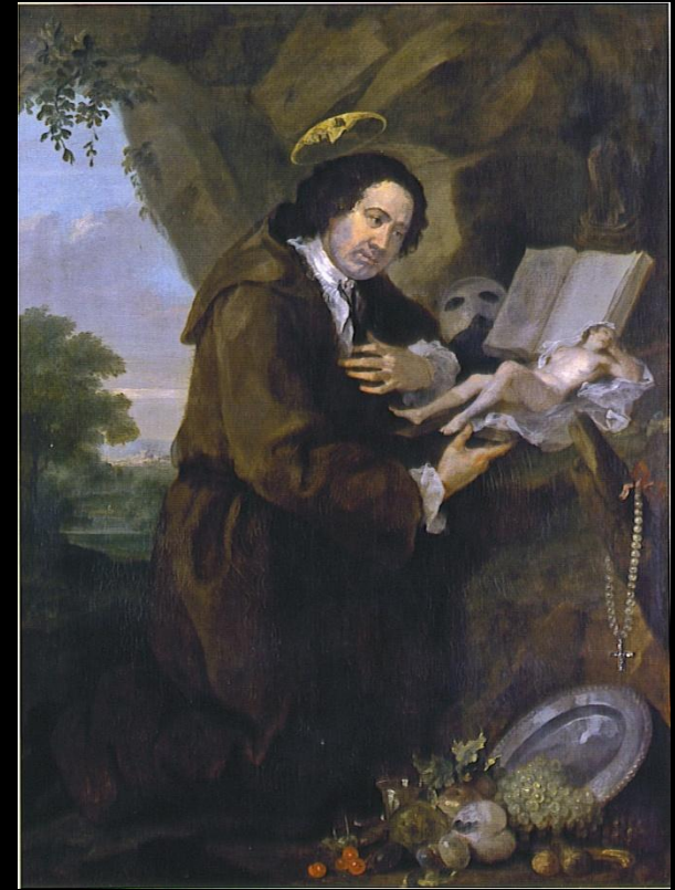
На картине Хогарта Фрэнсис Дэшвуд в облике св. Франциска изучает вместе с Библией эротический трактат.