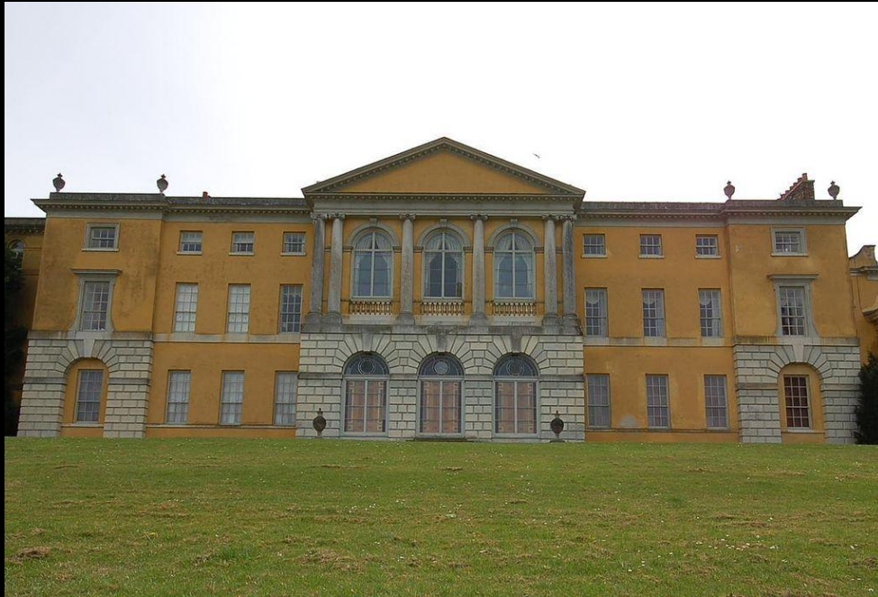
Уэст-Уайком — загородный дом Фрэнсиса Дэшвуда.

Клубы Адского Пламени: были феноменом XVIII века. Первый из них был основан в начале XVIII века герцогом Вартоном (Warthon). Наиболее известным был клуб сэра Фрэнсиса Дэшвуда. Дэшвуд был близким другом Бенджамина Франклина, хотя его членство в клубе недоказано. В любом случае, Дэшвуд и Франклин являются соавторами "Молитвенной книги Франклина". Эти клубы были закрытыми группами на политических интригах как разновидности оккультизма.