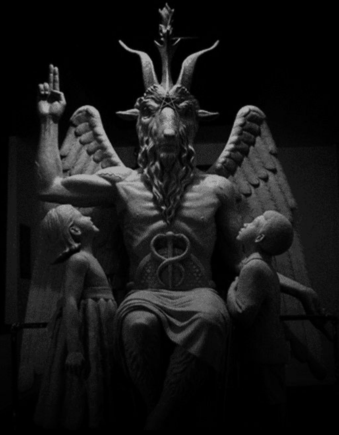
Статуя Бафомета, установленная в США

Но не все так просто... Существует несколько групп исповедующих Сатанизм.