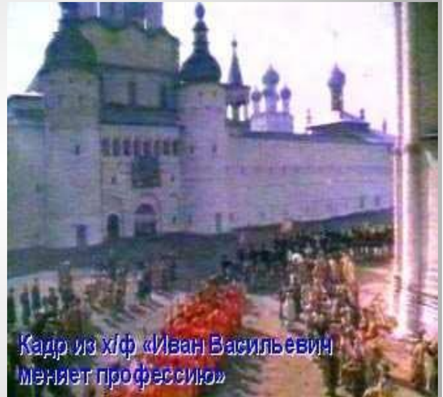
Кадр из х/ф «Иван Васильевич меняет профессию»