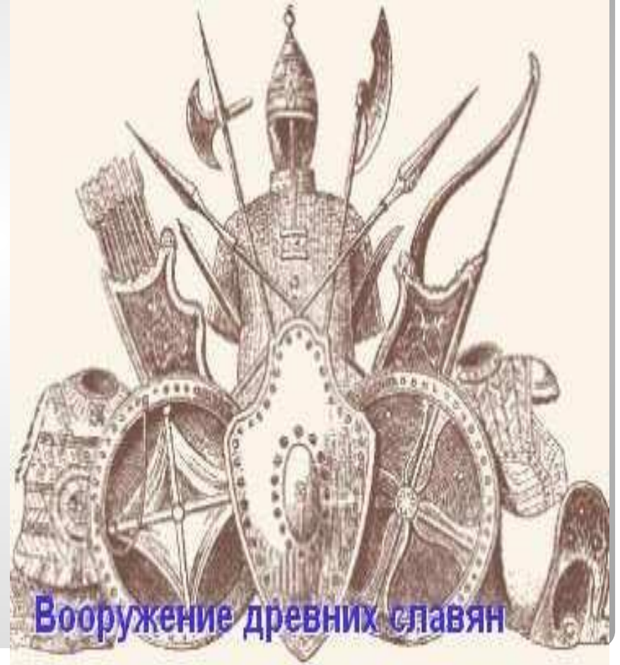
Вооружение древних славян