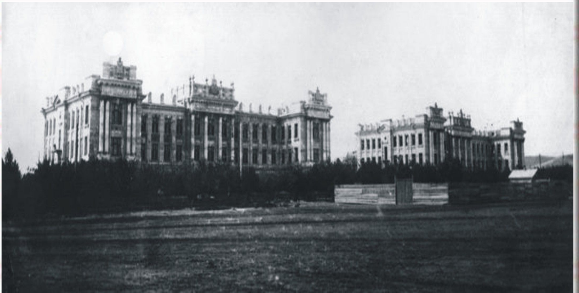
Панорама Университетского городка Саратовского императорского университета, архитектор Мюфке, 1914 год