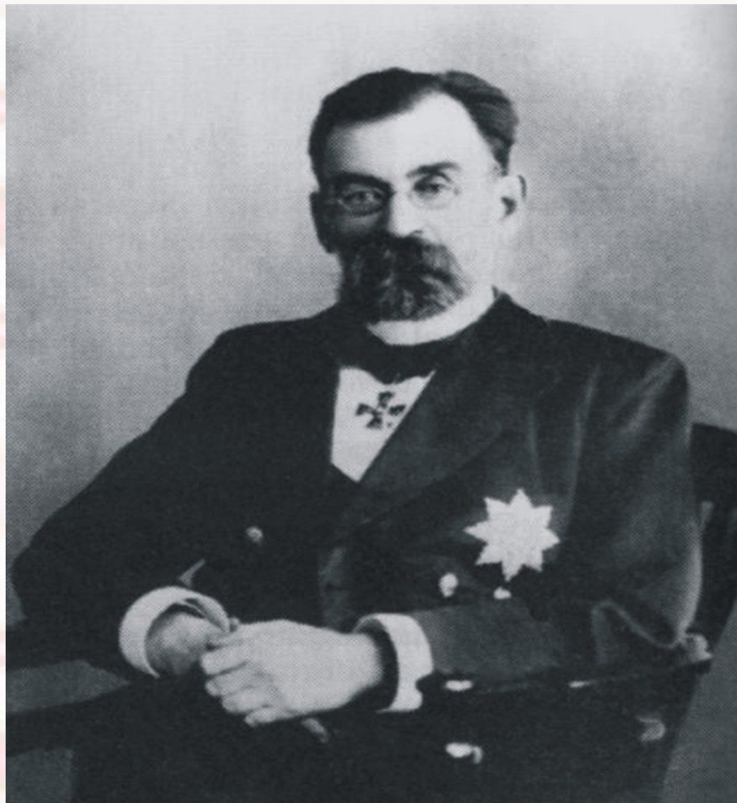
В.И. Разумовский, 1909 год