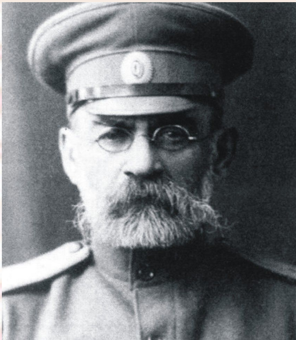
В.И. Разумовский, 1916 год

В марте 1916 г. В. И. Разумовский был направлен в район военных действий на Западном фронте.