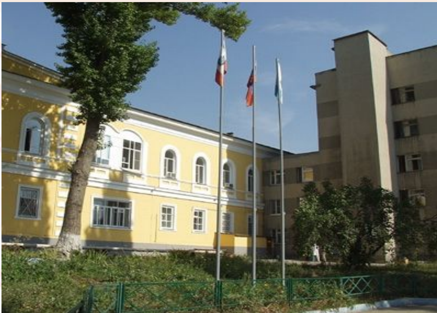
Городская клиническая больница № 2 имени В. И.Разумовского