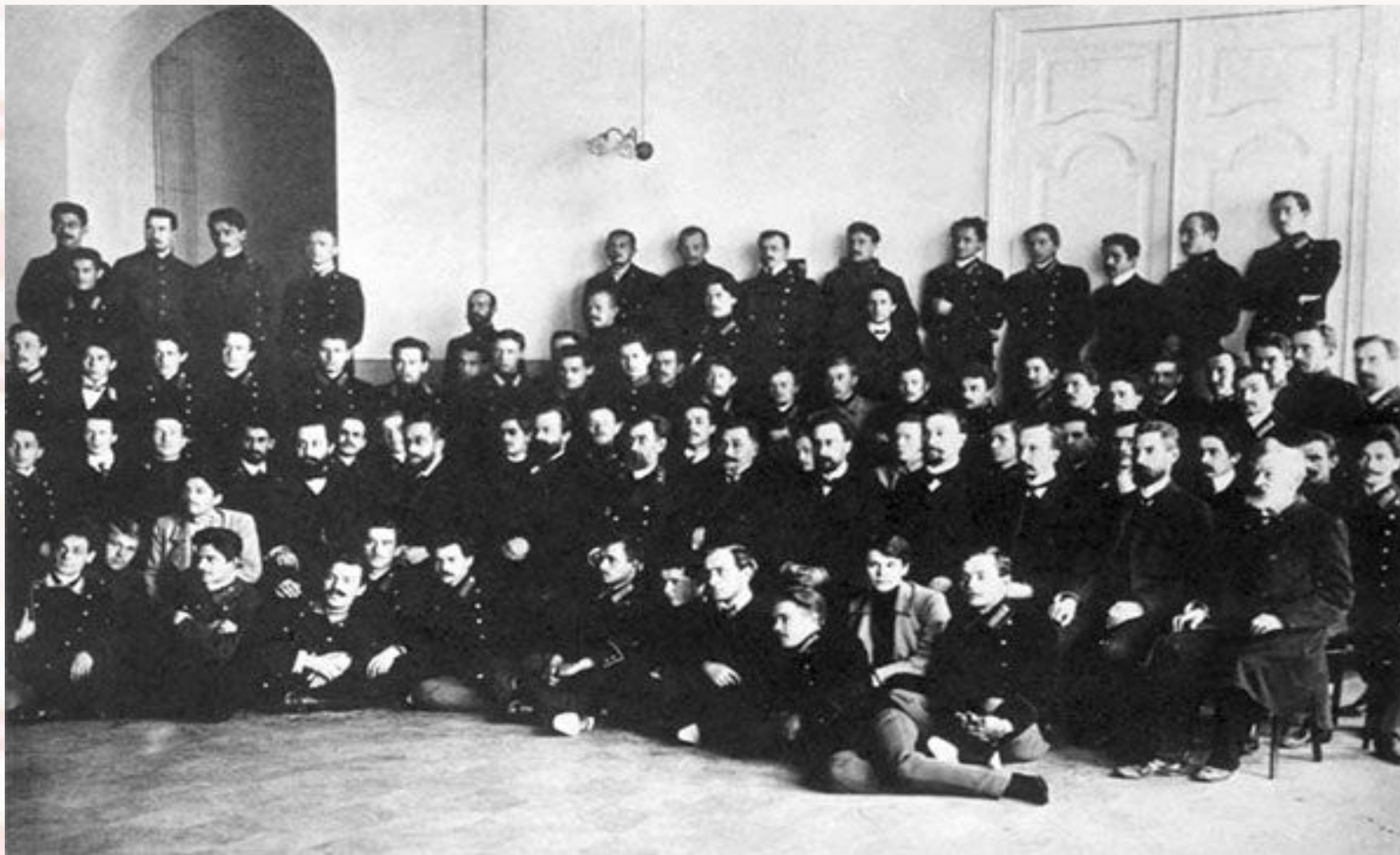
Профессора и студенты Саратовского университета, 1909 год