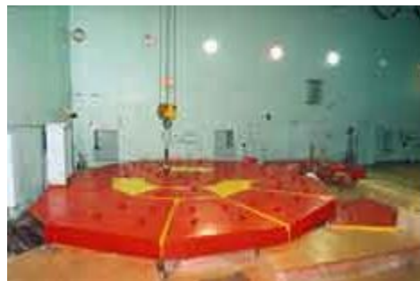
Реакторный зал Первой АЭС