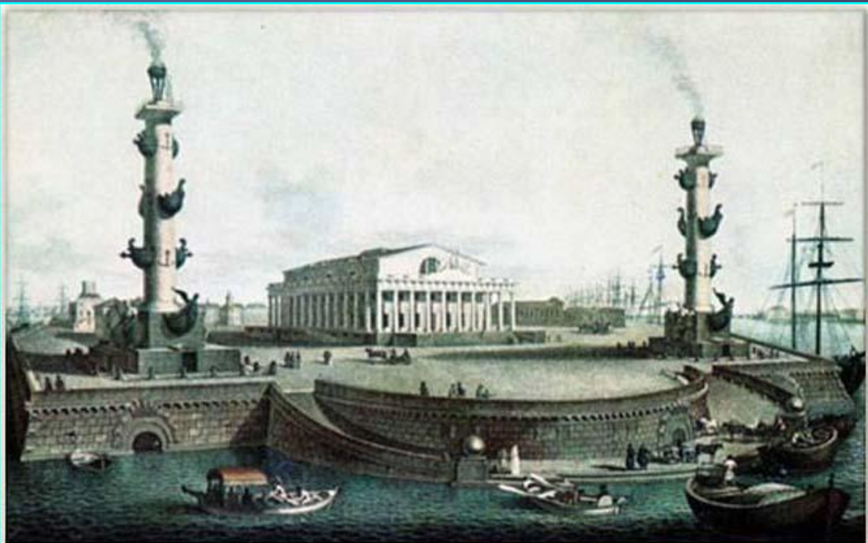
«Стрелка Васильевского острова и Биржа». Гравюра И. В. Ческого. 1817 г.