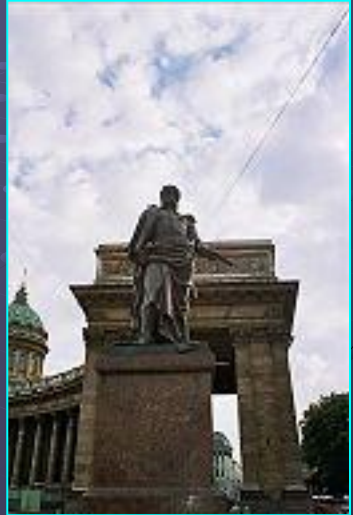
Генерал Барклай Де Толли