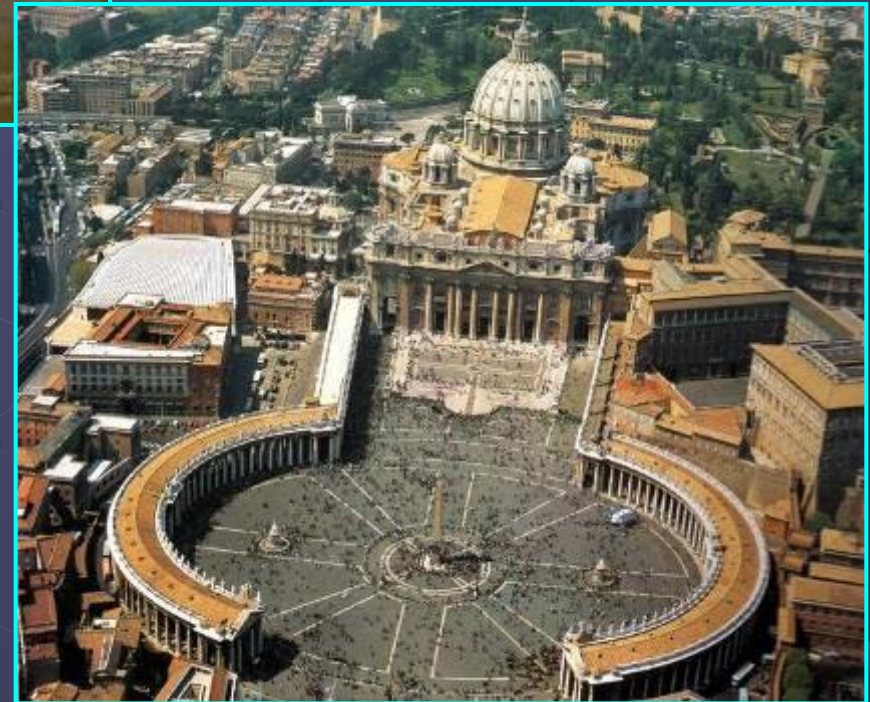
Собор Святого Петра в Ватикане.