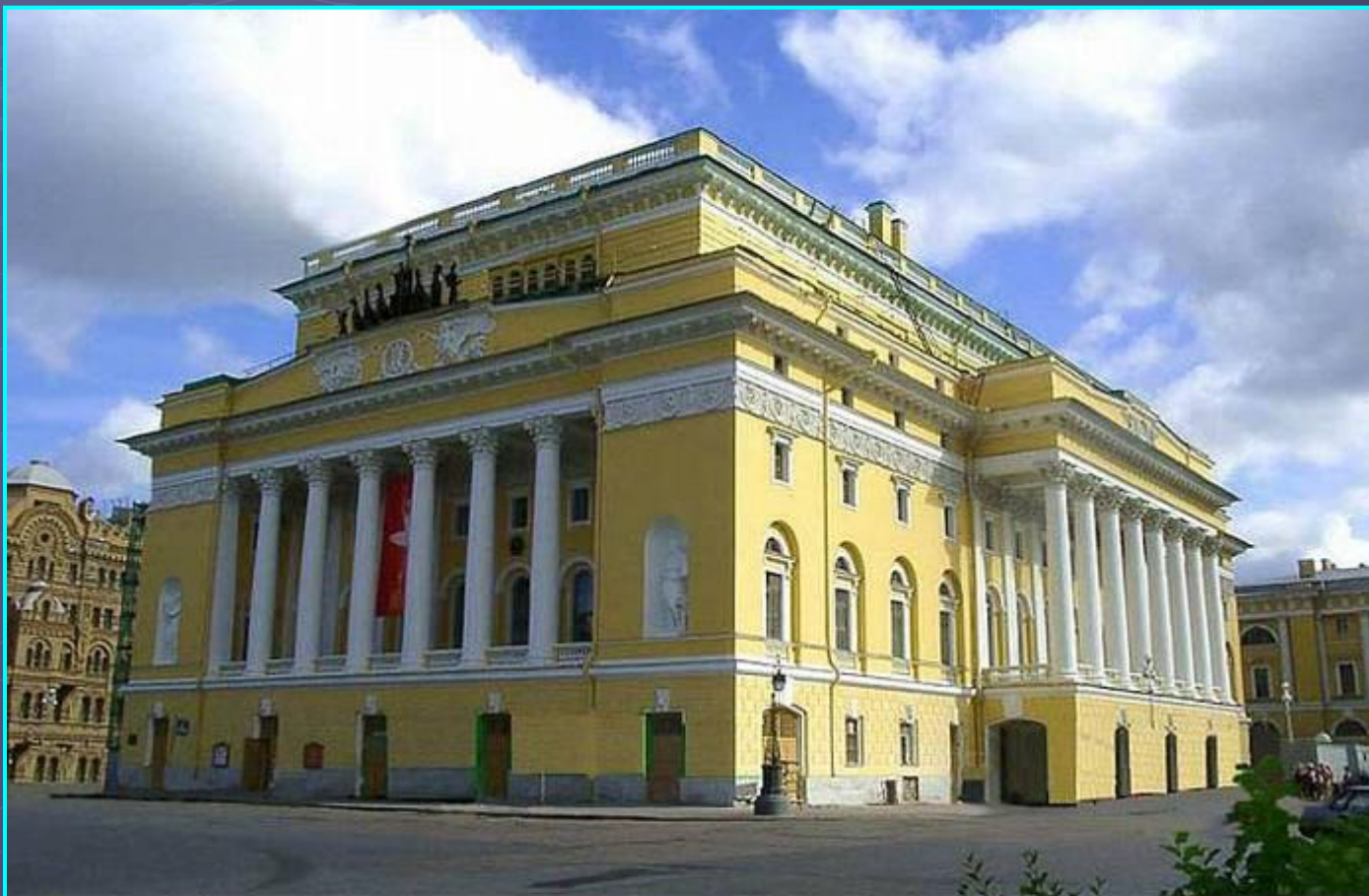
Здание Александринского театра. Вид с северо-запада. Архитектор К. И. Росси. 1832. Санкт-Петербург