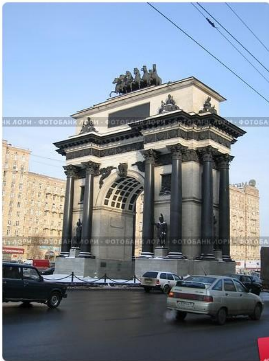
Триумфальная арка на Кутузовском проспекте в Москве

На площади нынешнего Белорусского вокзала выозвели Триумфальную арку (позднее перенесена на Кутузовский проспект), скульптор И.П. Витали