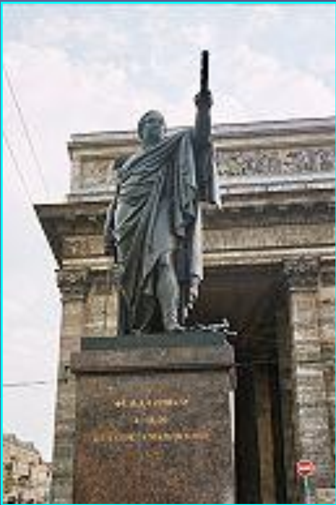
Фельдмаршал, граф Голенищев-Кутузов