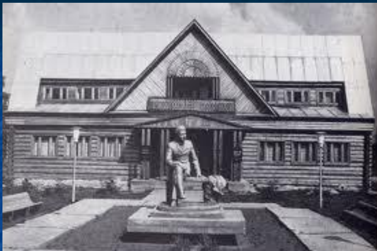
Дом-музей в селе Кырлай.