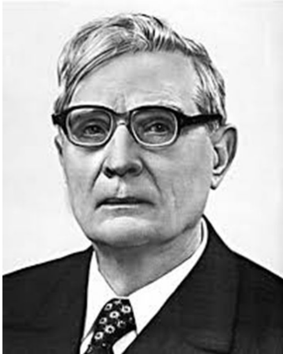
Сулов Михаил Андреевич , член Политбюро, « серый кардинал » Кремля

Диссидент- инакомыслящий человек, несогласный с линией партии