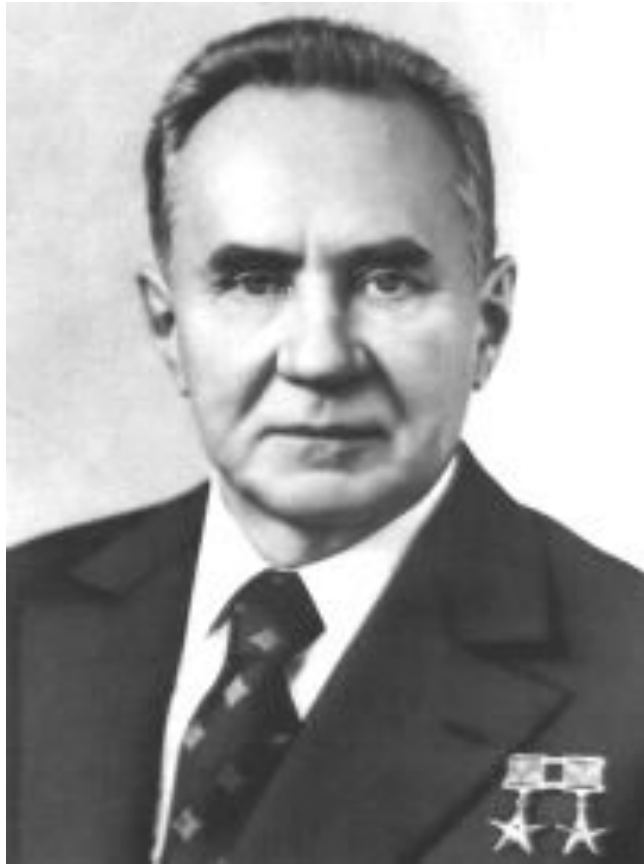
Косыгин Алексей Николаевич, председатель Совмина