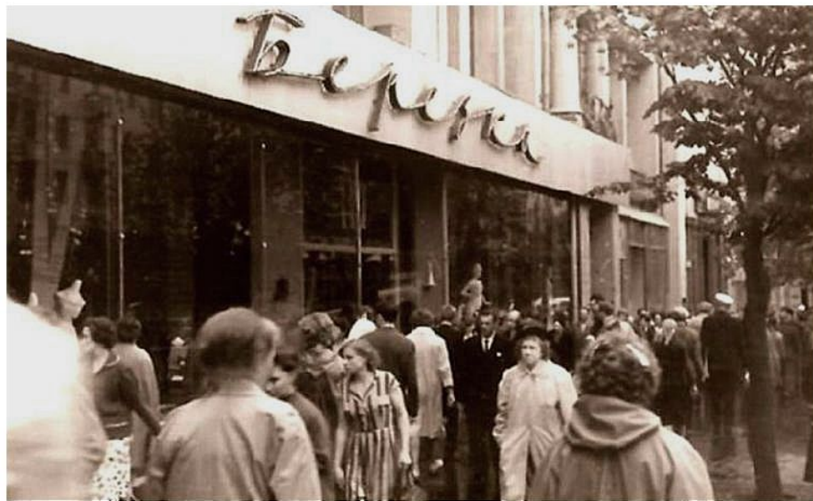
У магазина «Березка». Москва, 1962.