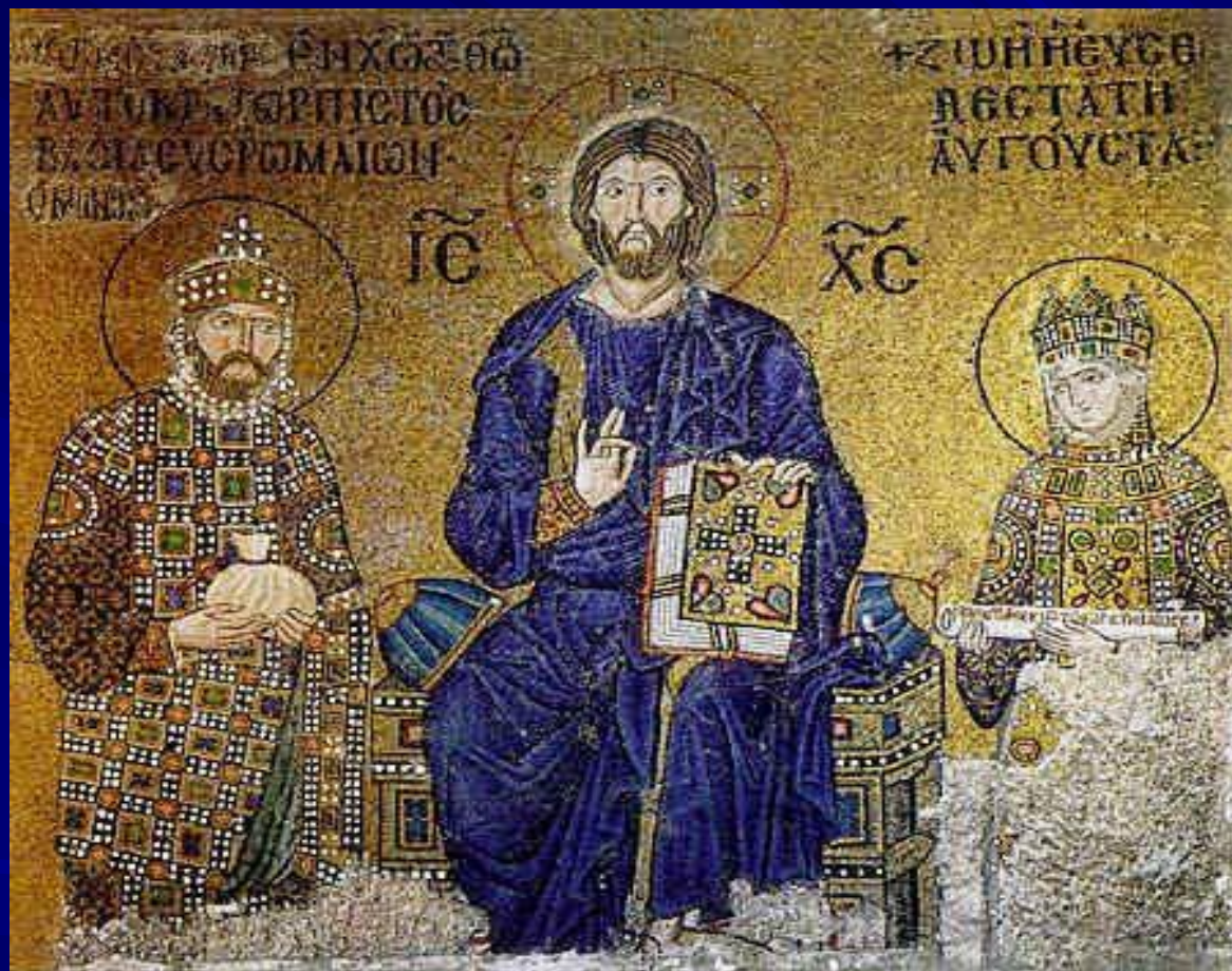
Приношение даров императором Константином IX Мономахом и императрицей Зоей