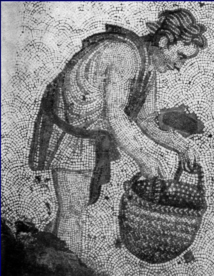
Фрагмент мозаичного пола Большого дворца императоров в Константинополе. 5 в.