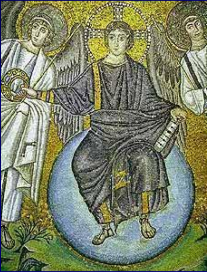
S. Vitale, Ravenna Apse mosaic Detail