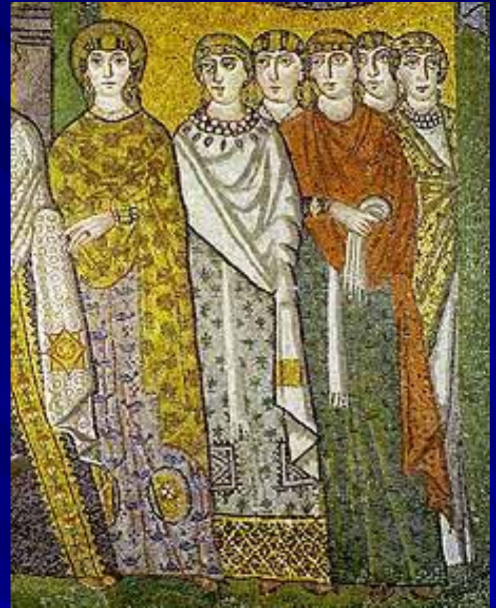
Theodora with courtiers Detail S. Vitale, Ravenna