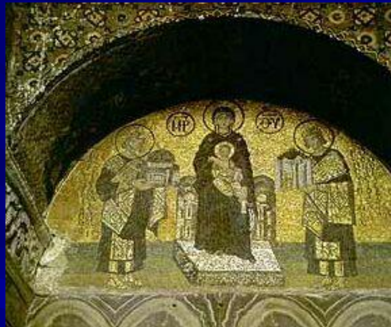
Приношение даров Константином и Юстинианом Мозаика в южном вестибюле Святой Софии Константинополь 11 век