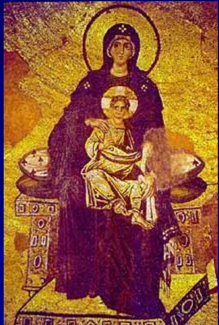
Богоматерь с младенцем. Мозаика. Собор Св.Софии в Константинополе