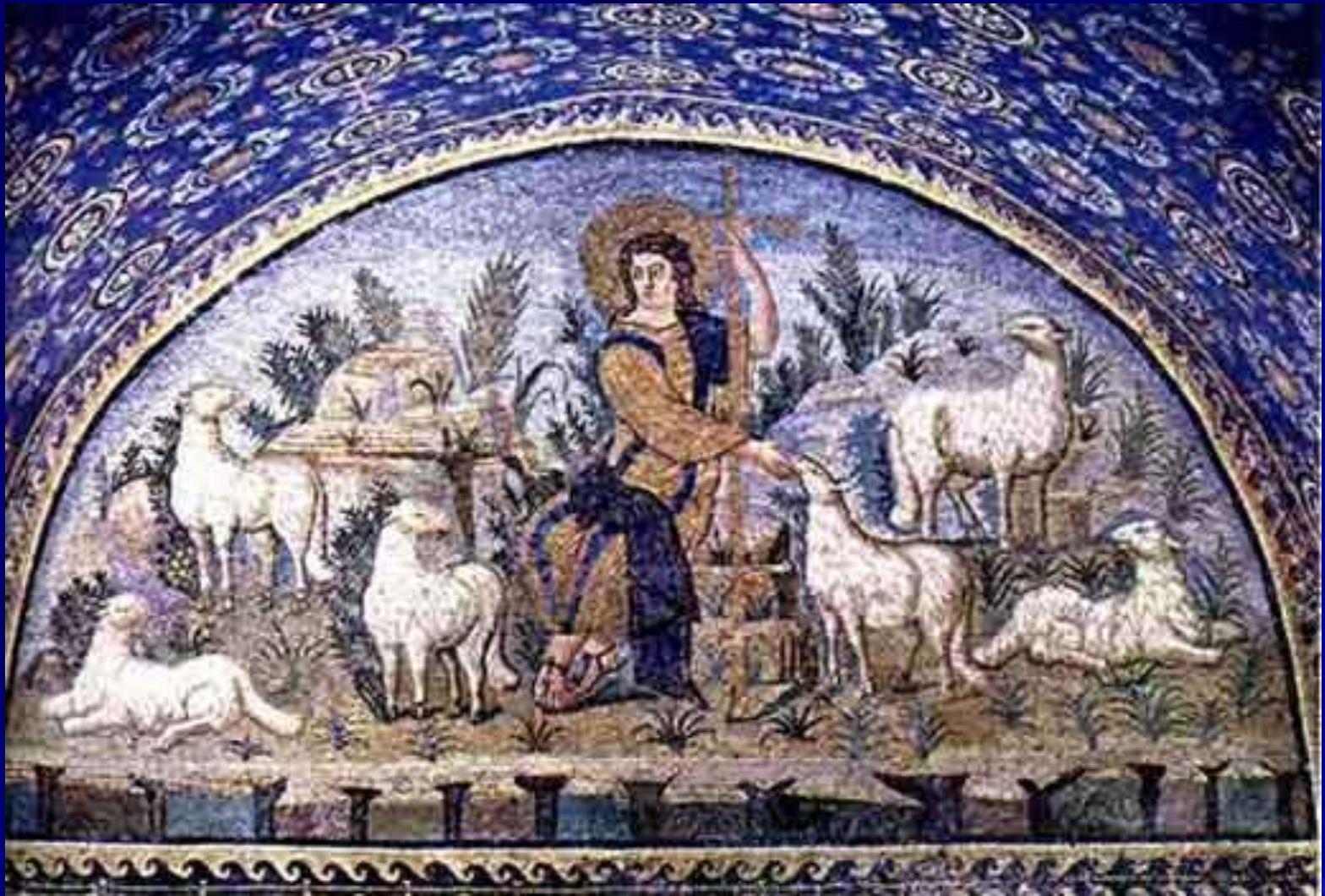
Добрый пастырь. Мавзолей Галлы Плацидии. Равенна