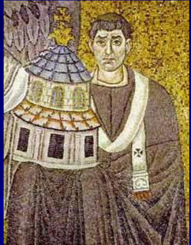
S. Vitale, Ravenna Apse mosaic Detail