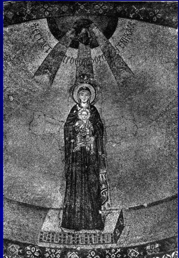
Богоматерь с младенцем. Мозаика абсиды церкви Успения в Никее. Вскоре после 787 г.