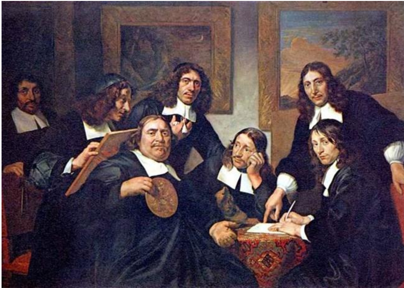
Ян де Брай. Старшины гильдии художников Харлема. 1675 год.