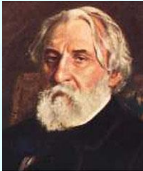
Иван Сергеевич Тургенев

Только ею, только любовью держится и движется жизнь.