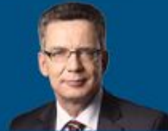
Thomas de Maizière