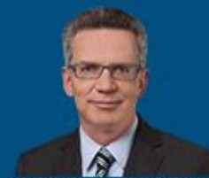
Thomas de Maizière