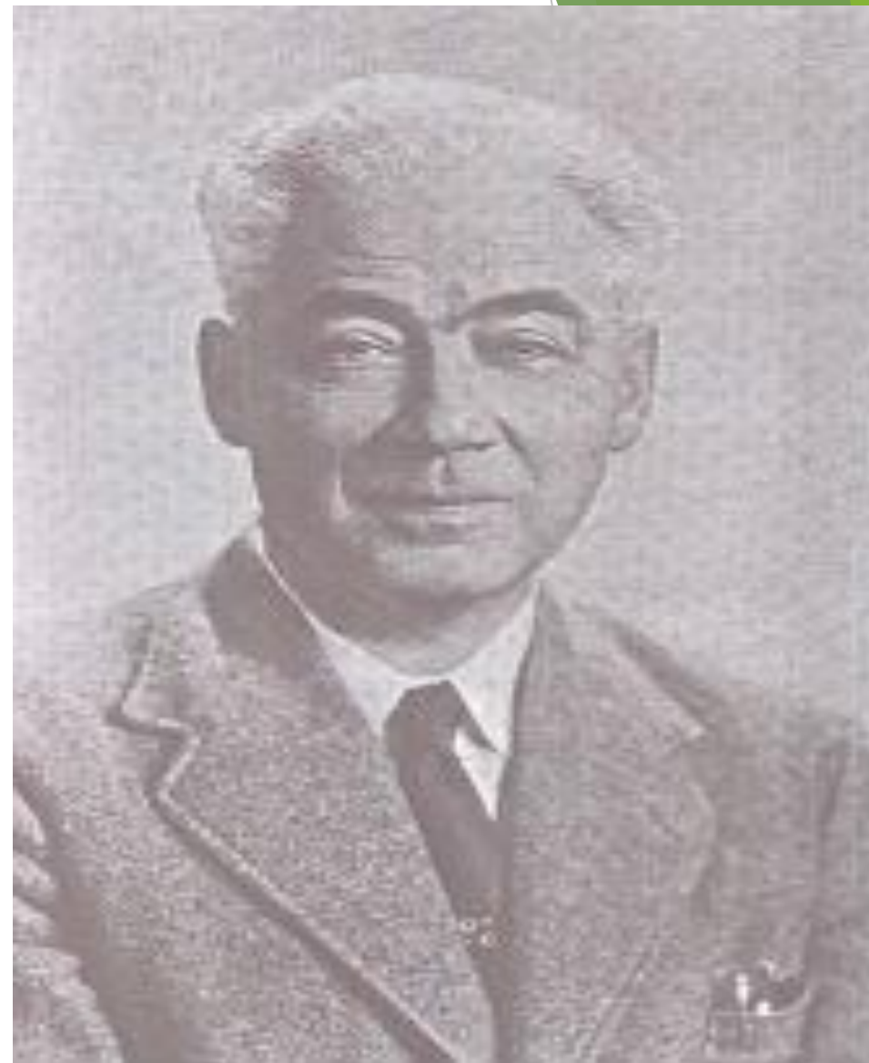
Бенедетто Котрульи ("О торговле и современном купце" 1458)