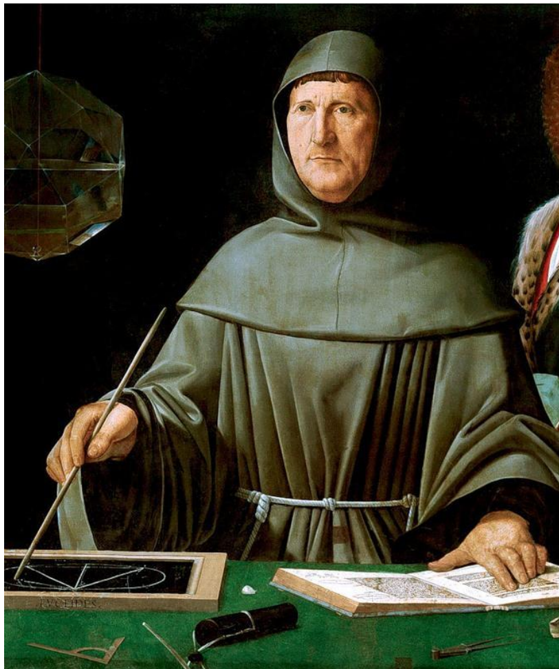
Лука Пачоли ("О счетах и записях")