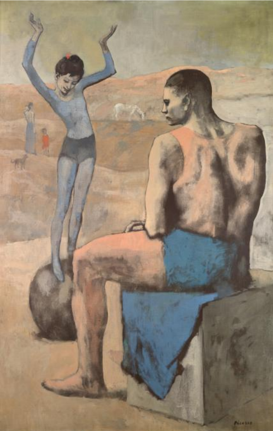
П.Пикассо «Девочка на шаре», 1905 147*95 Музей им.Пушкина