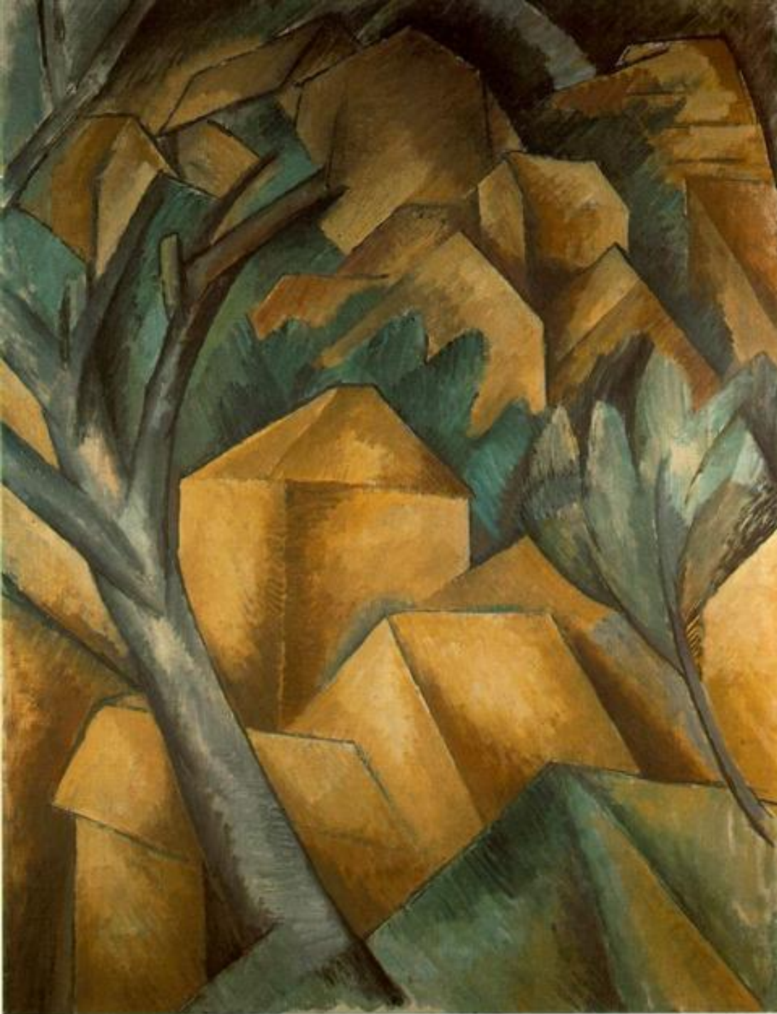
«Дома в Эстаке», 1908