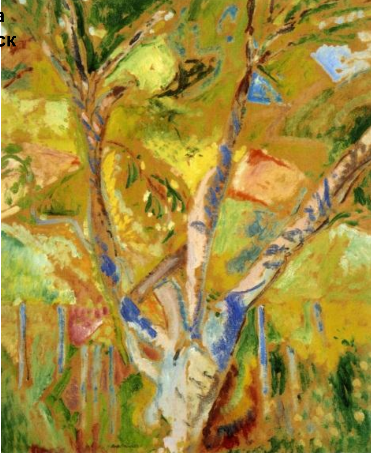
А.Морера «Фовистский пейзаж»