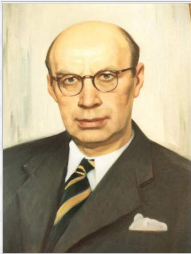
Сергей Сергеевич Прокофьев