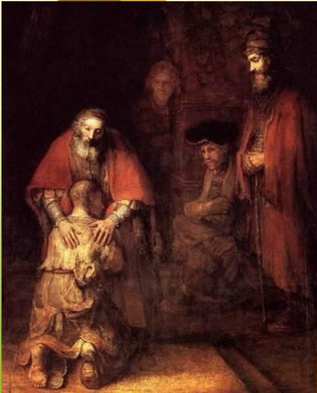
Рембрандт. Возвращение блудного сына