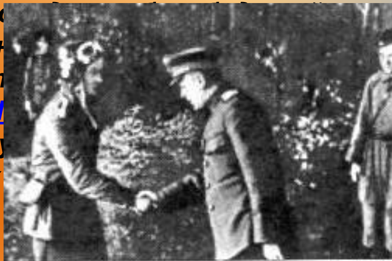
А.Новиков поздравляет Маресьева с присвоением звания Героя Советского Союза

20 июля 1943 года Алексей Маресьев во время воздушного боя с превосходящими силами противника спас жизни 2 советских лётчиков и сбил сразу два вражеских истребителя В полк зачастили корреспонденты, среди них был будущий автор книги «Повесть о настоящем человеке» Борис Полевой 20 июля 1943 года Алексей Маресьев во время воздушного боя с превосходящими силами противника спас жизни 2 советских лётчиков и сбил сразу два вражеских истребителя В полк зачастили корреспонденты, среди них был будущий автор книги «Повесть о настоящем человеке» Борис Полевой . 24 августа 1943 года Маресьеву присвоено звание Героя Советского Союза за спасение жизни двух лётчиков и сбивание сразу двух немецких истребителей.