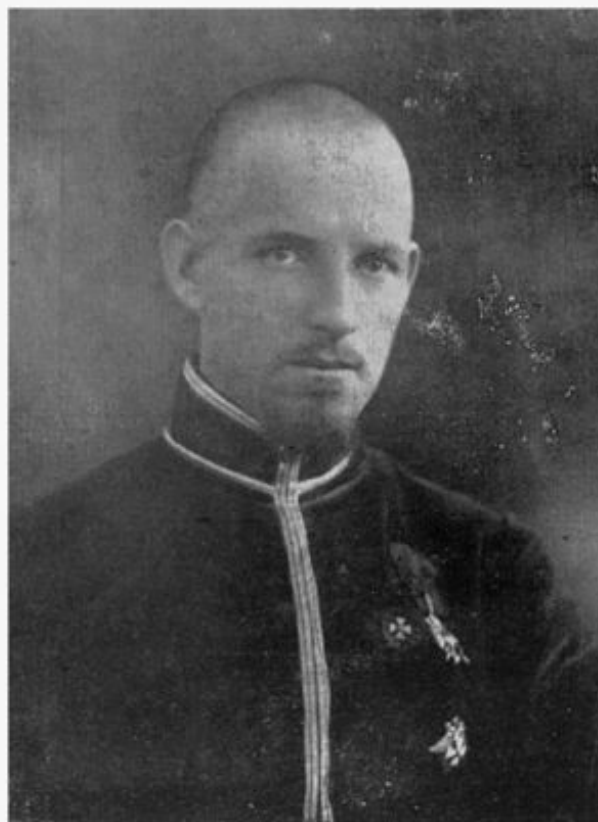
Сотник Федір Тимченко учасник бою під Крутами