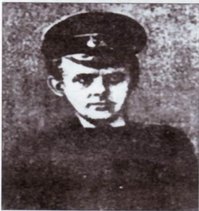
Микола Ганкевич, загинув у бою під Крутами.