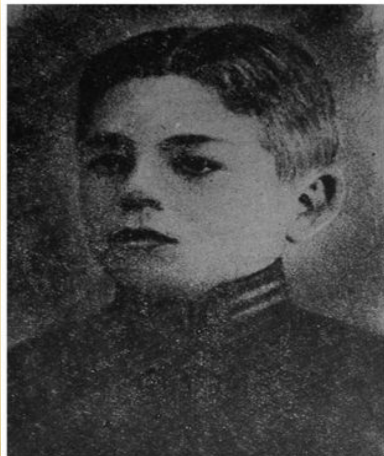
Микола Корпан загинув у бою під Крутами