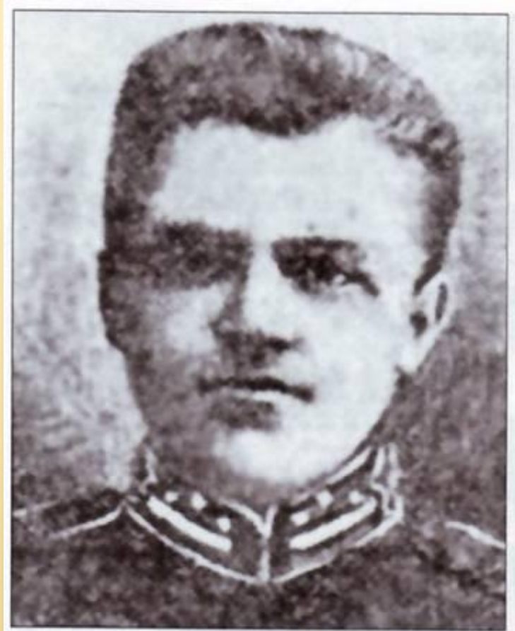
Аверкій Гончаренко, командуючий боєм під Крутами.

Бойовий наказ наша молодь виконала, а пам'ять полеглих оповита ореолом слави, стала зразком для майбутніх поколінь!»