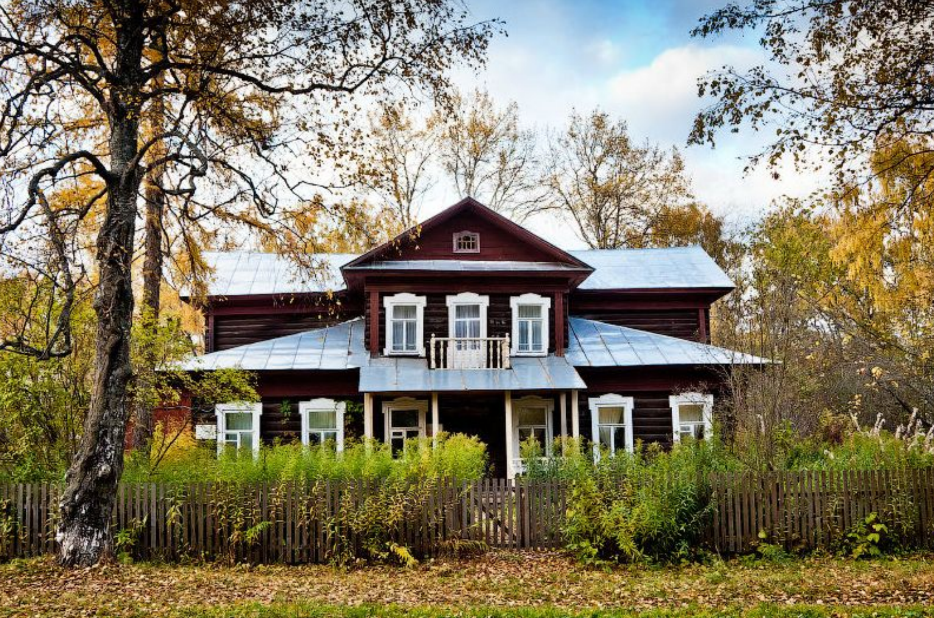
Дом-музей Анны Ахматовой и Николая Гумилёва