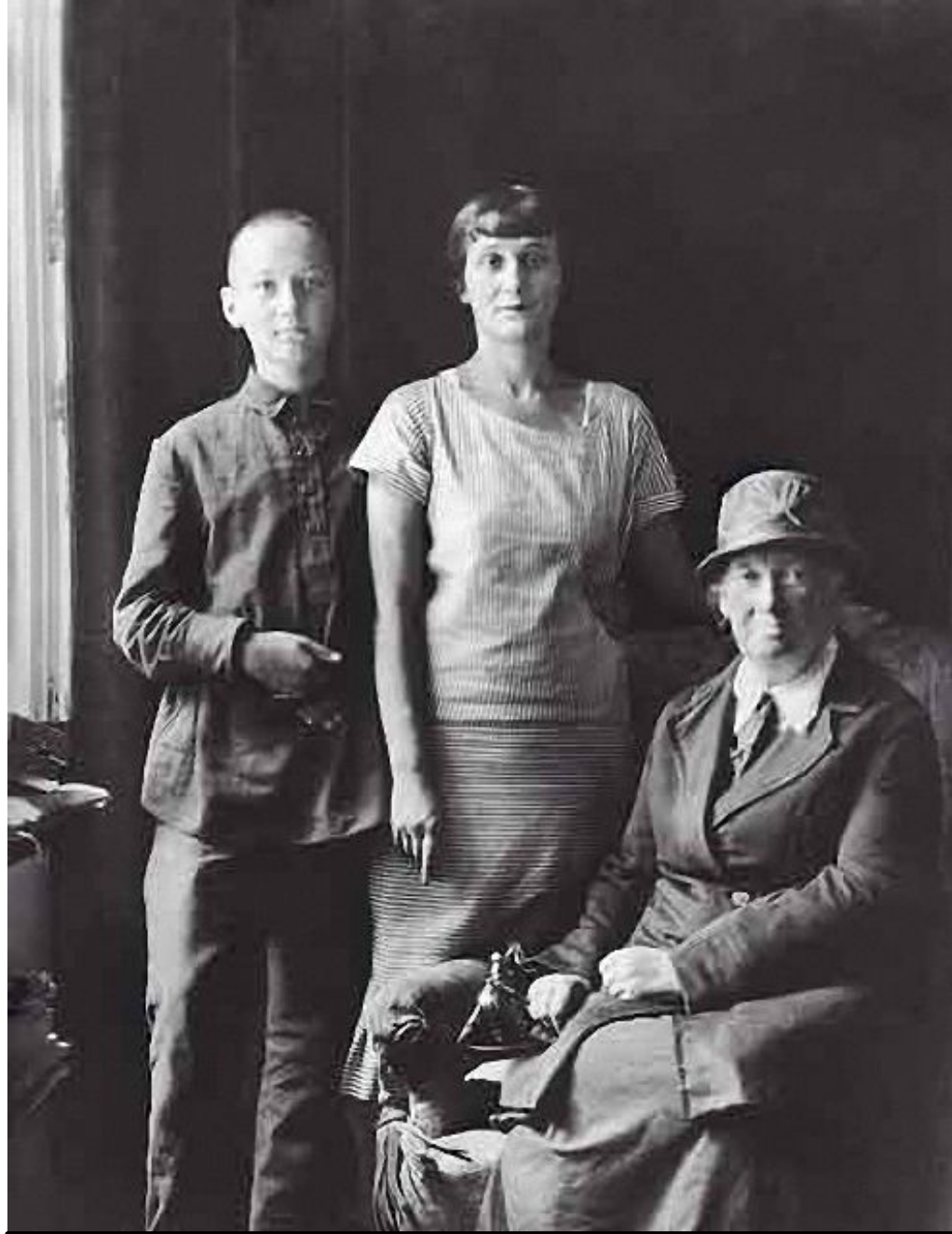
Николай Гумилёв с мамой и бабушкой

После окончания гимназии уехал учиться в Сербскую