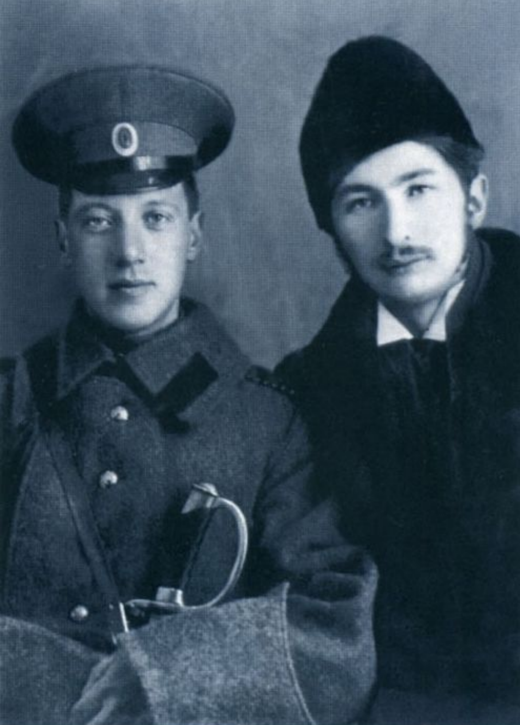
Николай Гумилёв и Сергей Городецкий