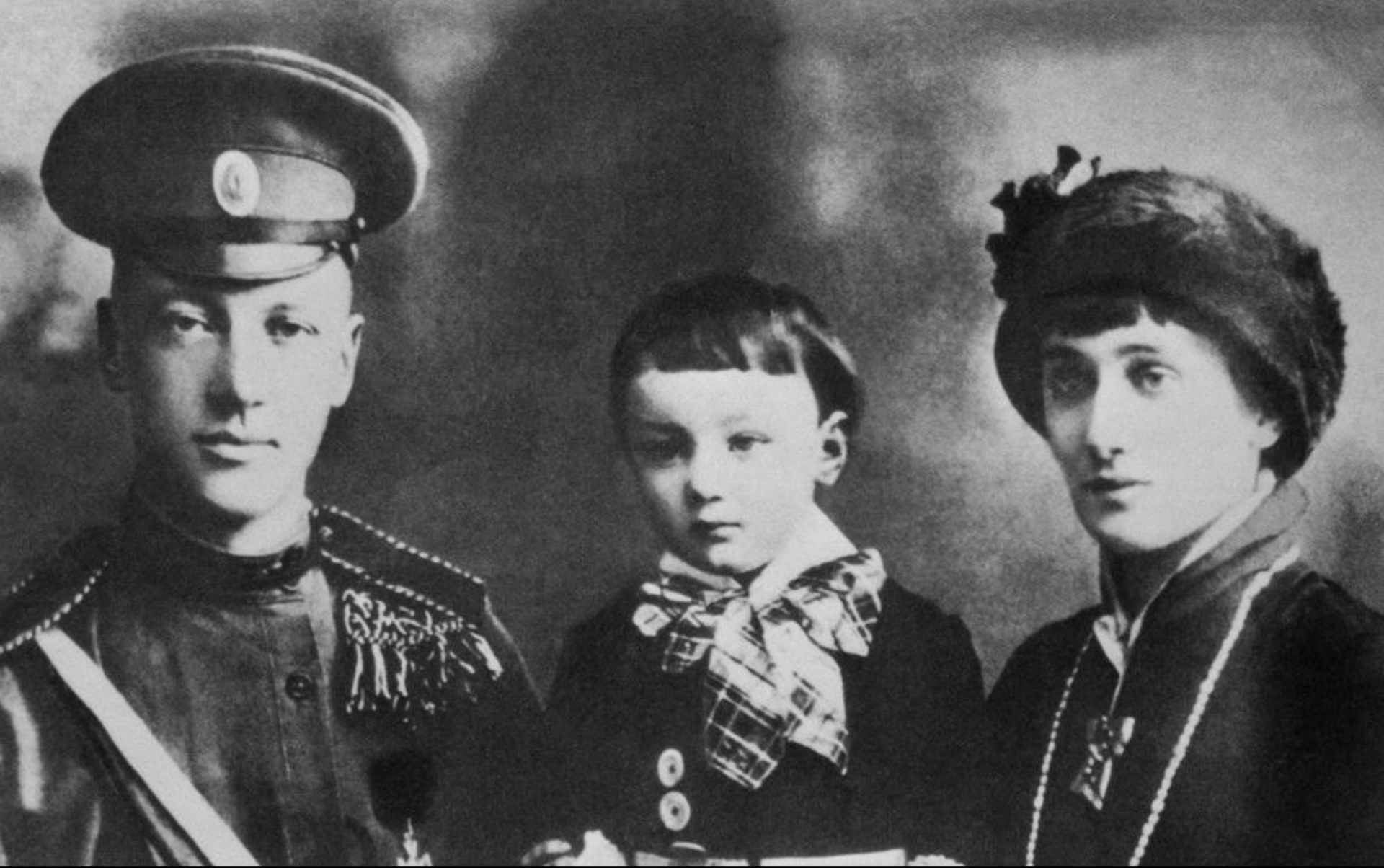
Николай Гумилёв, Лев Гумилёв, Анна Ахматова