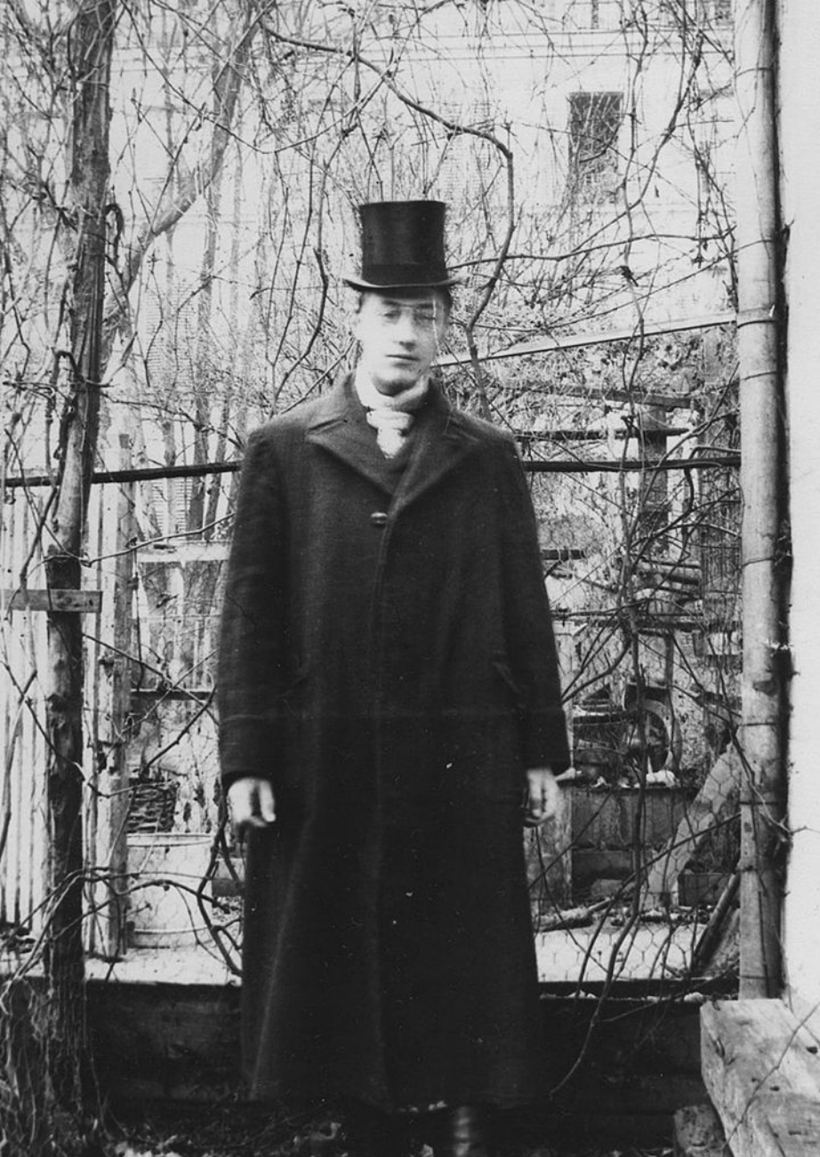
Гумилёв Н. С. в Париже, 1906 г.

С 1906 года Николай Гумилёв жил в Париже и много путешествовал.