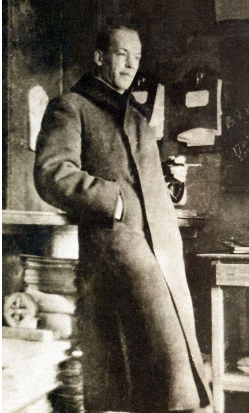
Николай Гумилёв. 1921 год