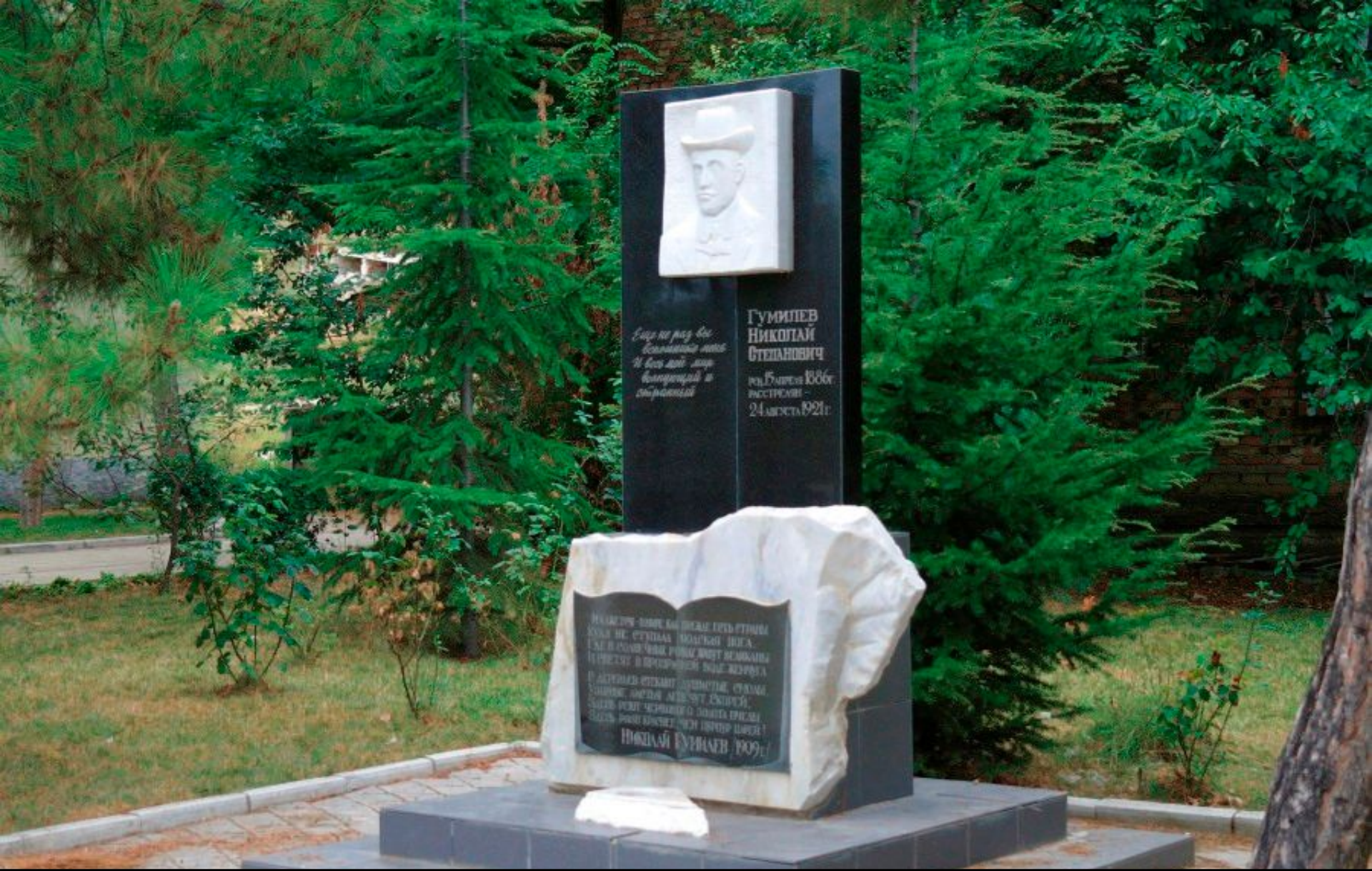
Памятник Николаю Гумилёву в Коктебеле