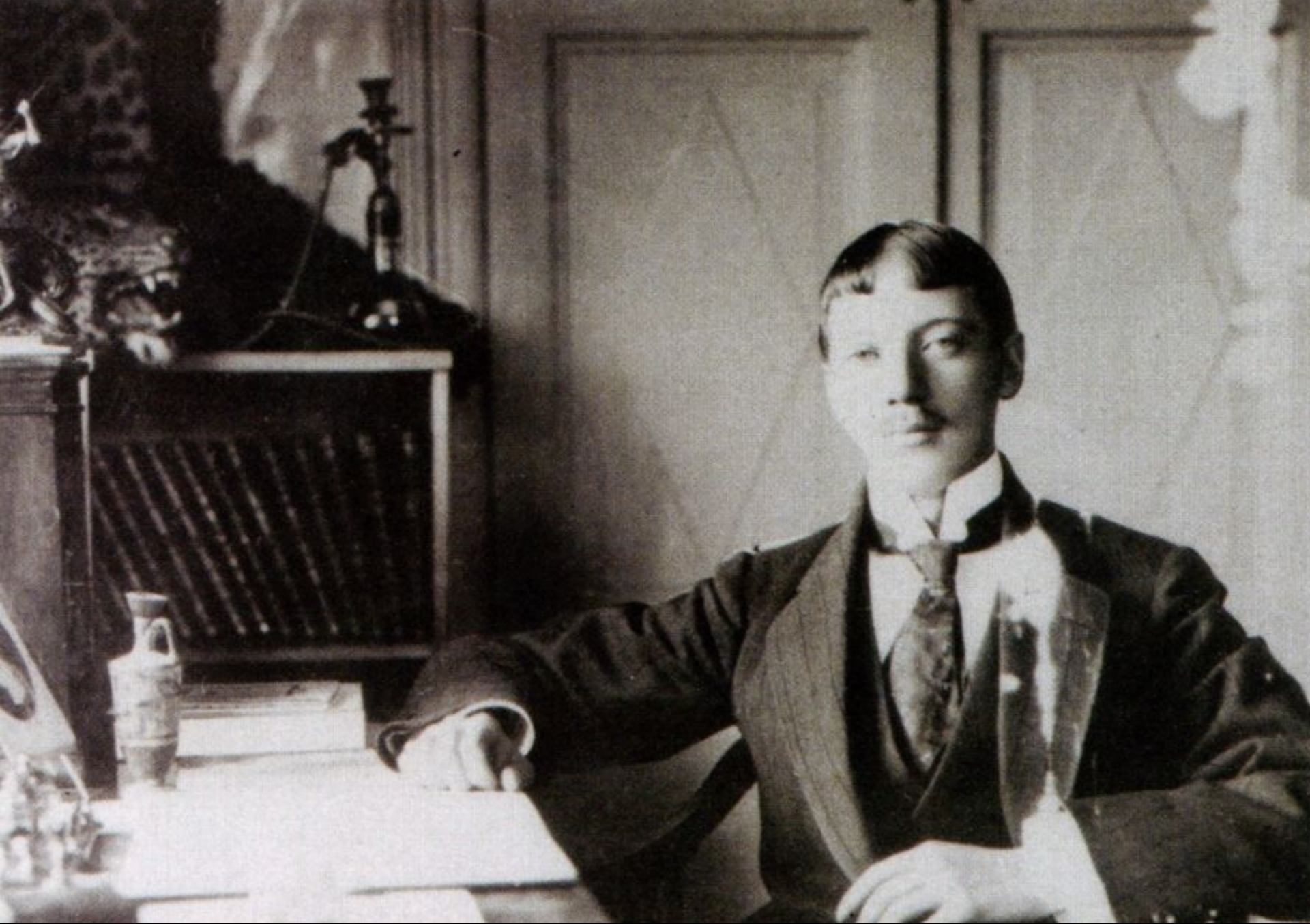
Фотография 1907 года