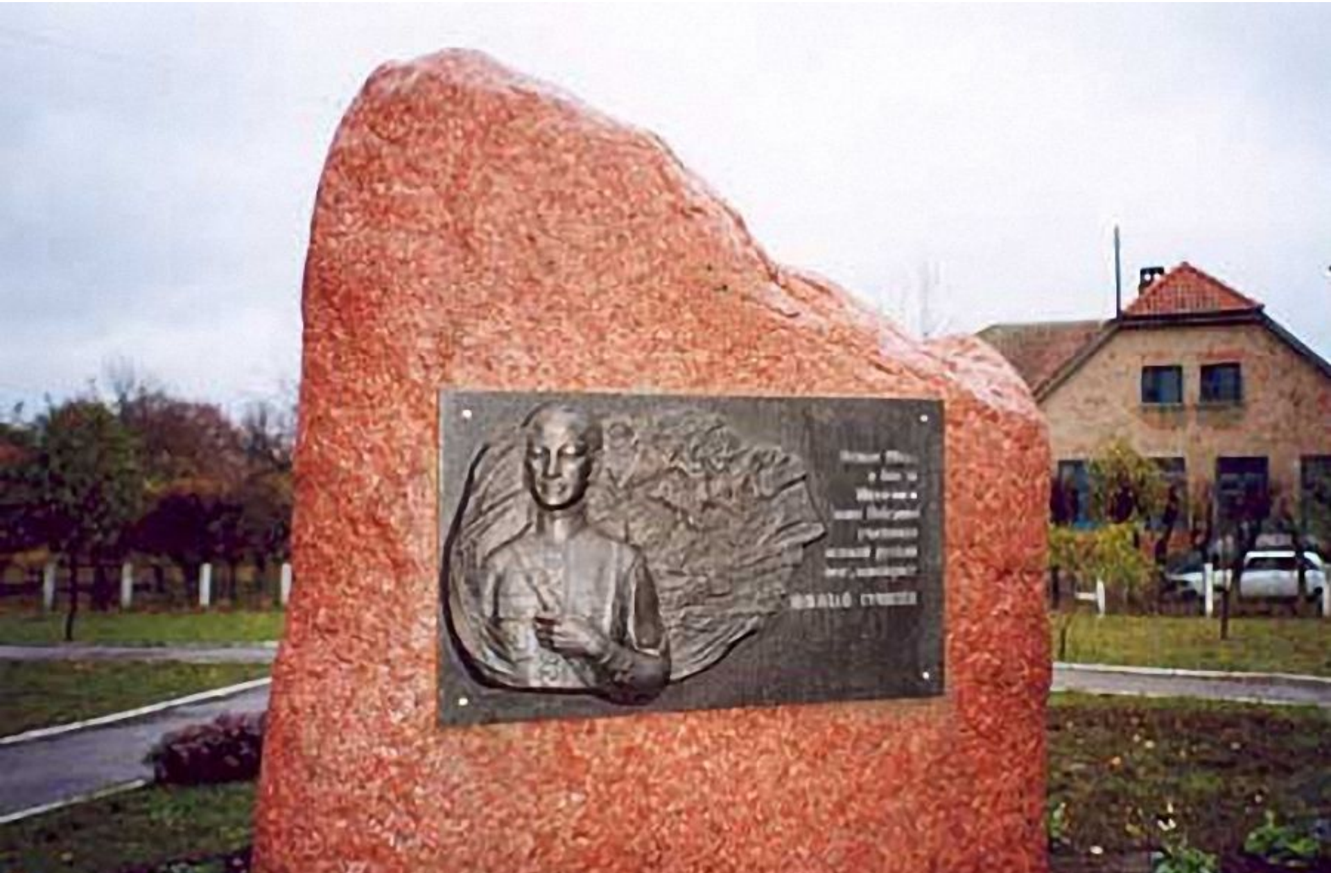
Памятник Гумилеву в Победино