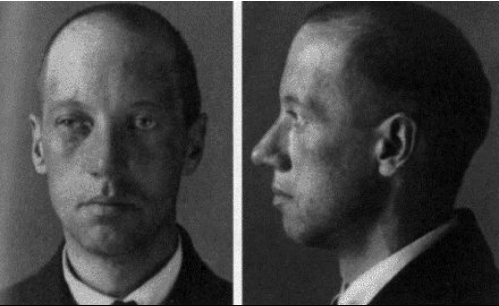
Николай Гумилёв. Фото из следственного дела.