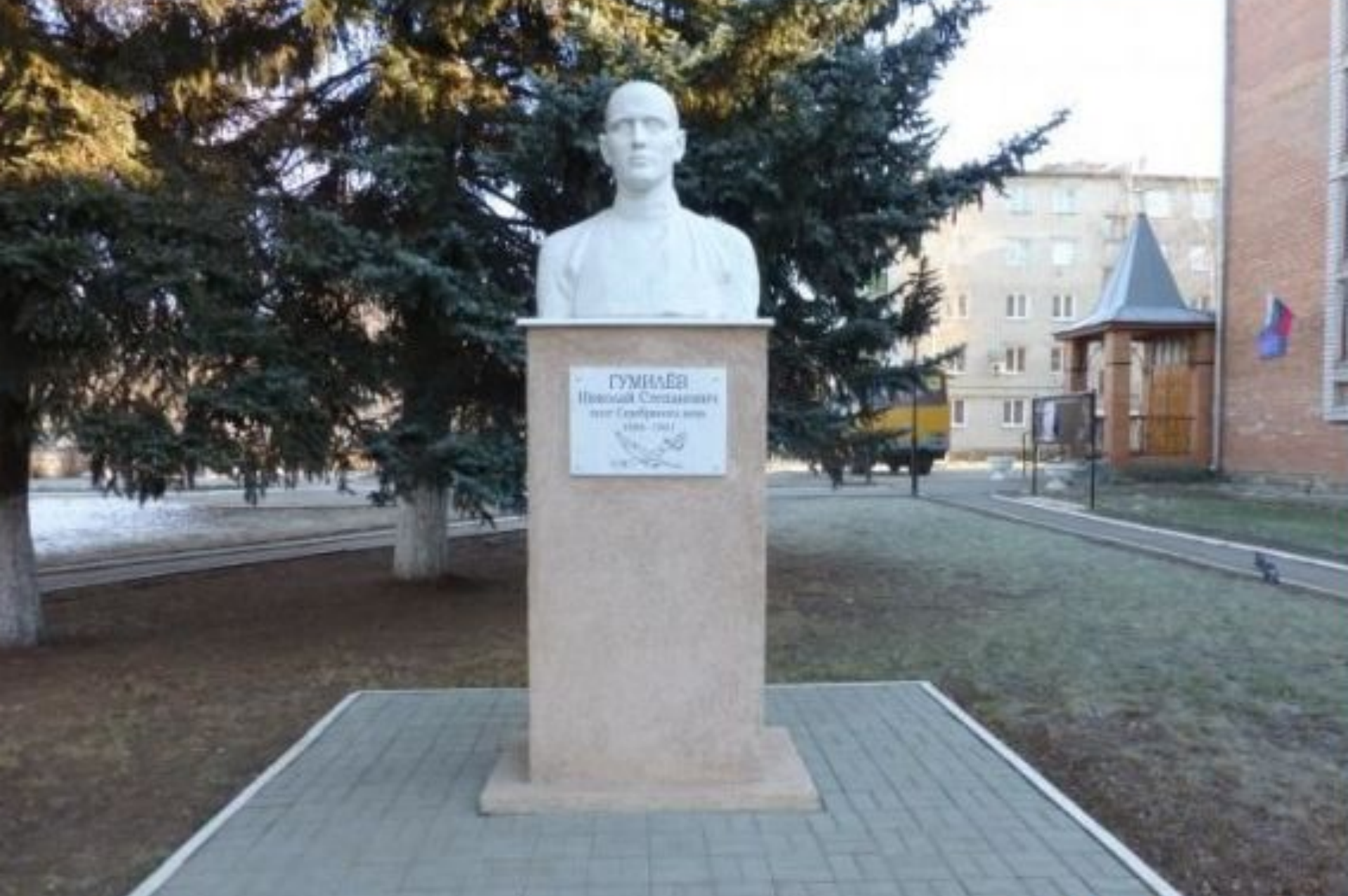
Памятник Гумилёву на родине его предков