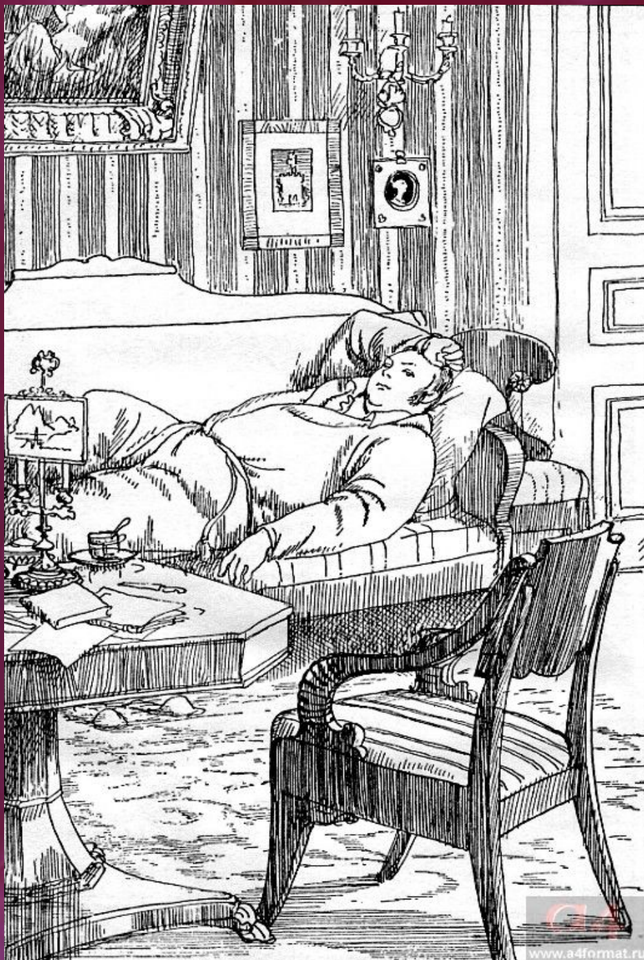
Обломов на Гороховой улице. Художник Г. Мазурин