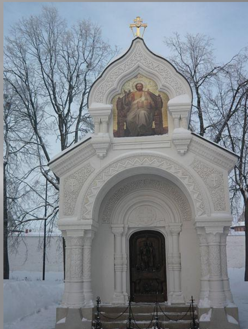
Гробница Д. Пожарского в Спасо-Евфимиевом монастыре (г. Суздаль)