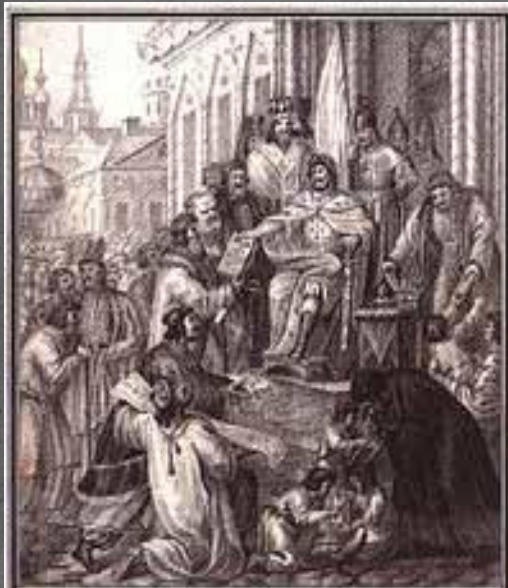
ЯРОСЛАВЪ ЗАКОНДАТЕЛЬ 1019-1054

Заслугой Ярослава стало начало оформления письменного законодательства на Руси. В 1016 г. появился «Устав новгородцев» (другое название «Правда Ярослава»), сыновья князя составили «Правду Ярославичей» (1072), которую дополнили Владимир Мономах (внук Ярослава) и более поздние князья. Все эти законы составили первый древнерусский кодекс — «Русскую Правду». Здесь собраны обычаи и судебные решения, позволяющие нам узнать о жизни и быте людей того времени.