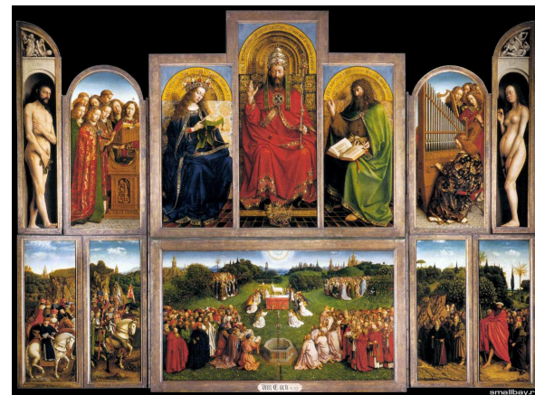
Гентский Алтарь, Ян ван Эйк

Становление нового искусства началось в первой трети XV в. Живописцу Яну ван Эйку безоговорочно принадлежит первенство в нидерландском ренессансе. Главное творение ван Эйка — грандиозный Гентский алтарь — полиптих (т.е. сложенный много раз) для одной из капелл в Генте, в котором выражено новое мировоззрение, новое представление о человеке и вселенной. Образ вселенной создают 12 изображений на наружных створках полиптиха (в закрытом виде) и 14 на внутренних (в раскрытом виде) — небесные сферы, населенные небожителями, и земля с ее долями, лесами, долинами и горами.