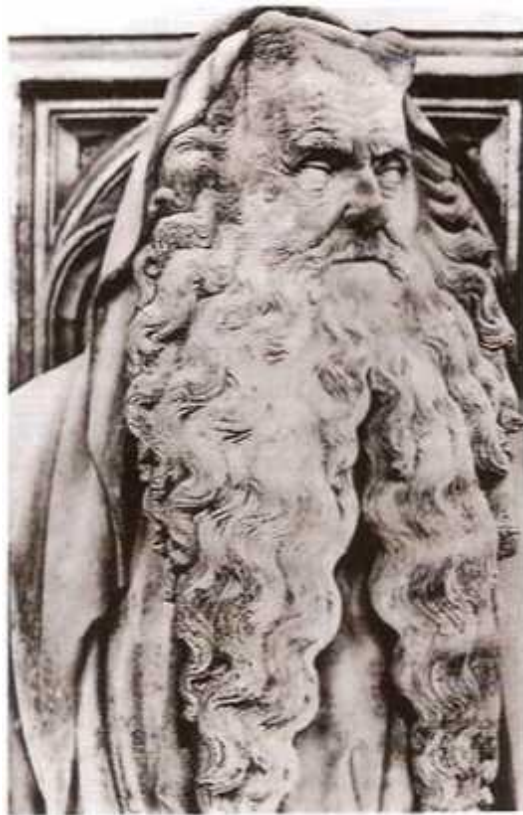
Пророк Моисей. Колодец пророков. 1394–1406. Монастырь Шанмоль, Дижон (Франция)