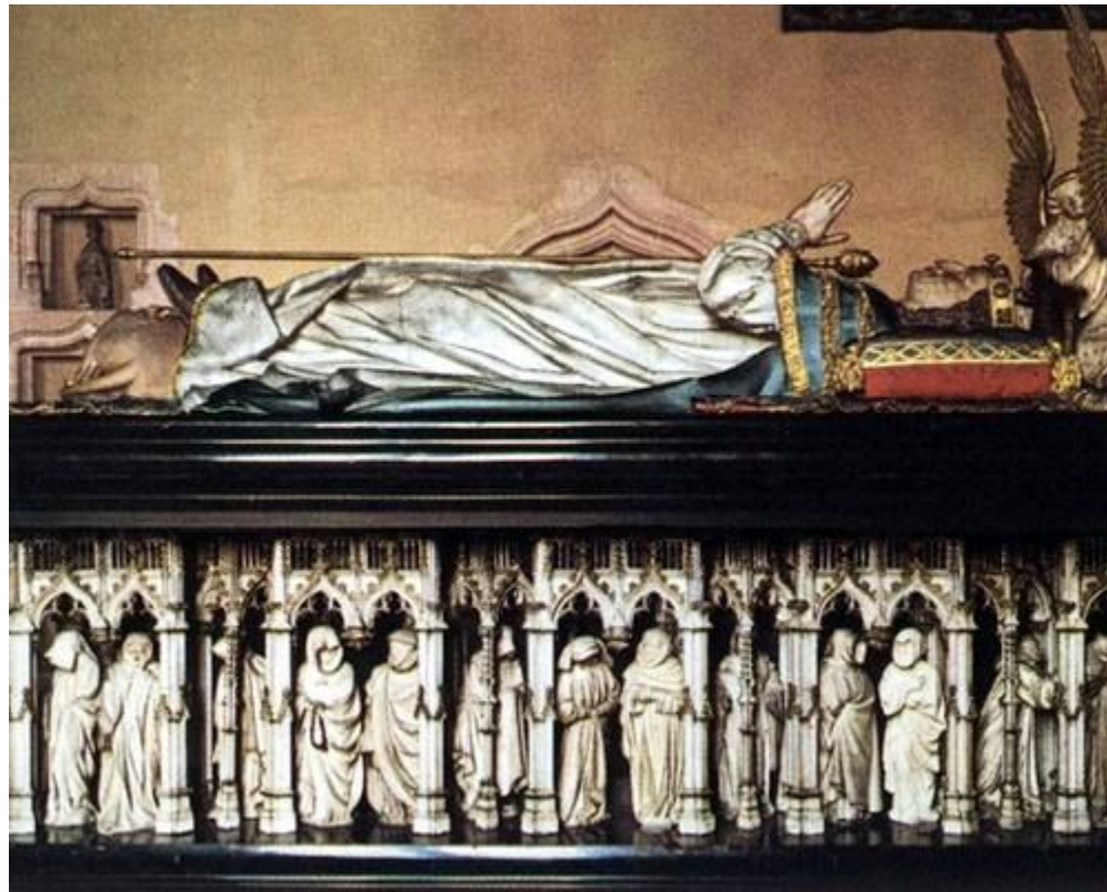
Фигуры плакальщиков для гробницы Филиппа Смелого