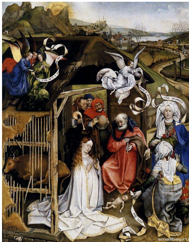
Кампен. Рождество, 1420 Музей изящных искусств, Дижон