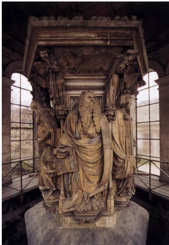
Колодец Моисея. 1395-1406 гг. Клаус Слютер. Археологический музей, Дижон.