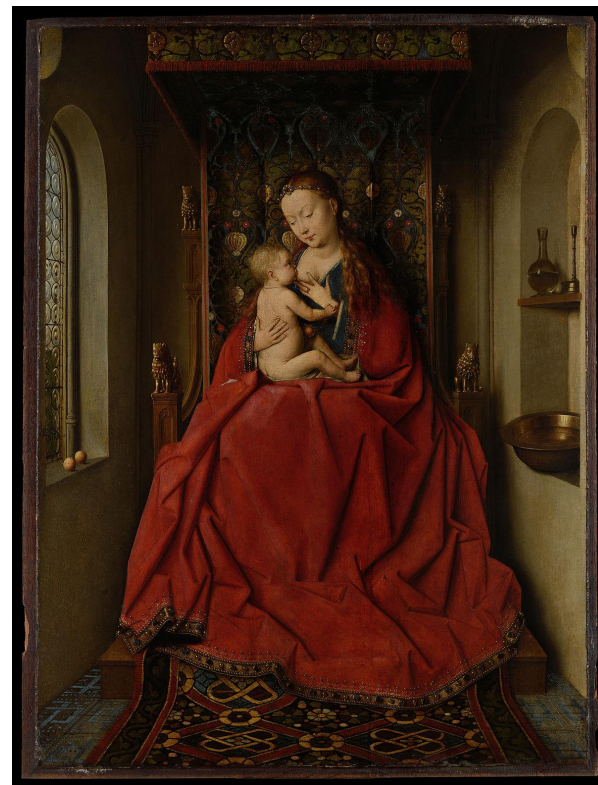
Лукка Мадонна., Ян ван Эйк

Ван Эйку традиционно приписывают изобретение техники масляной живописи. Это не совсем точно, поскольку способ применения растительных масел как связующего вещества для краски был известен и раньше. Но художник усовершенствовал этот способ и впервые применил масляную живопись при создании алтарных картин. Из Нидерландов эта техника постепенно распространилась в Италию и другие страны, вытеснив темперу.