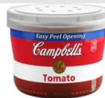
Томатный суп Микроволновой чаша МИКРОВОЛНОВЫЕ ЧАШИ CAMPBELL®