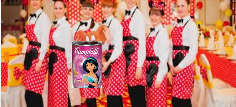
Акции в местах продаж с участием аниматоров (Disney), дегустации