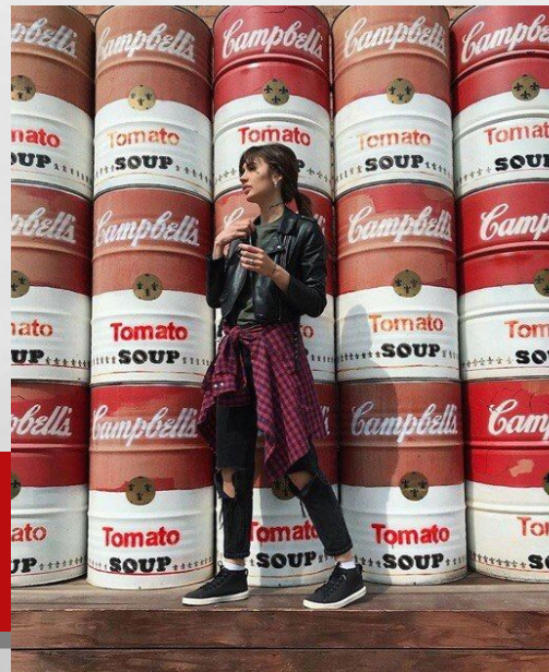
Фотозона Campbell's soup