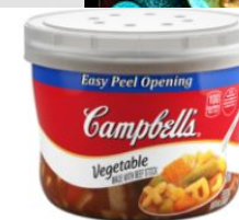
Овощной суп Микроволновой чаша МИКРОВОЛНОВЫЕ ЧАШИ CAMPBELL®