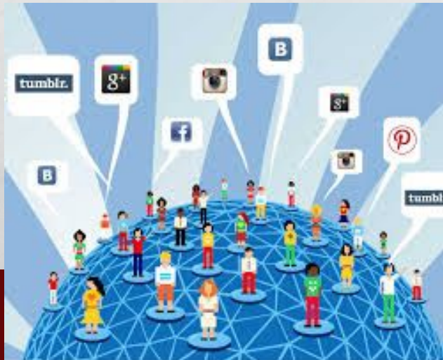
Интернет реклама, соц.сети