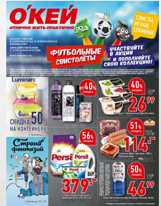
Печать в фирменной прессе супермаркетов