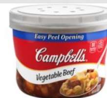
Овощной суп из говядины МИКРОВОЛНОВЫЕ ЧАШИ CAMPBELL®