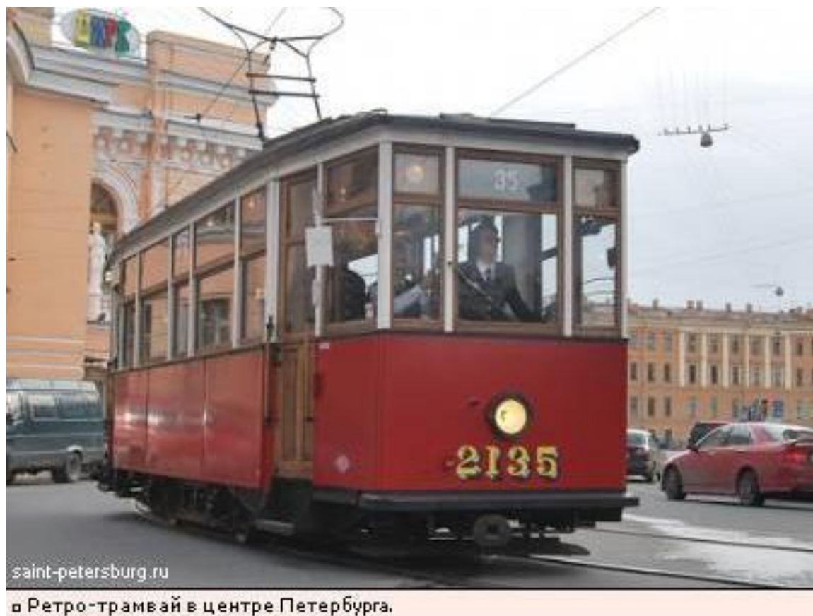
▫ Ретро-трамвай в центре Петербурга.

Пассажирское движение восстановили 15 апреля 1942 года — тогда на пять маршрутов вышли 116 трамвайных поездов которые выпускали в самом же Ленинграде на Кировском заводе.