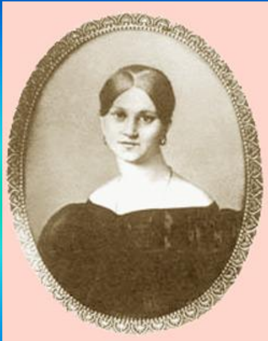
Анна Петровна Кёрн

И сердце бьется в упоенье, И для него воскресли вновь И божество, и вдохновенье, И жизнь, и слезы, и любовь.