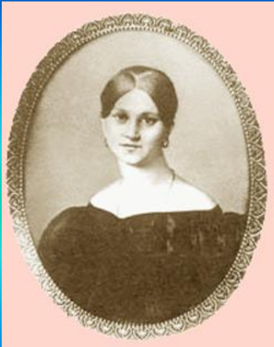
Анна Петровна Кёрн

И сердце бьется в упоенье, И для него воскресли вновь И божество, и вдохновенье, И жизнь, и слезы, и любовь.