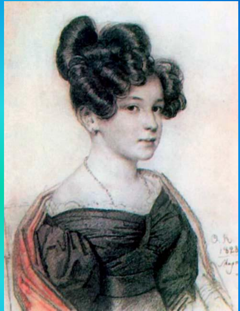
Анна Алексеевна Оленина

Я вас любил: любовь еще, быть может, В душе моей угасла не совсем; Но пусть она вас больше не тревожит; Я не хочу печалить вас ничем. Я вас любил безмолвно, безнадежно, То робостью, то ревностью томим; Я вас любил так искренно, так нежно, Как дай вам бог любимой быть другим.