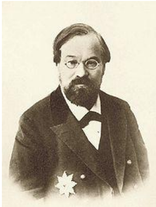
Николай Васильевич Бугаев.

РОДИЛСЯ В СЕМЬЕ ПРОФЕССОРА НИКОЛАЯ ВАСИЛЬЕВИЧА БУГАЕВА (1837—1903), ИЗВЕСТНОГО МАТЕМАТИКА И ФИЛОСОФА, ПРЕЗИДЕНТА МОСКОВСКОГО МАТЕМАТИЧЕСКОГО ОБЩЕСТВА (1891—1903), НАИБОЛЕЕ ЯРКОГО ПРЕДСТАВИТЕЛЯ МОСКОВСКОЙ ФИЛОСОФСКО-МАТЕМАТИЧЕСКОЙ ШКОЛЫ.