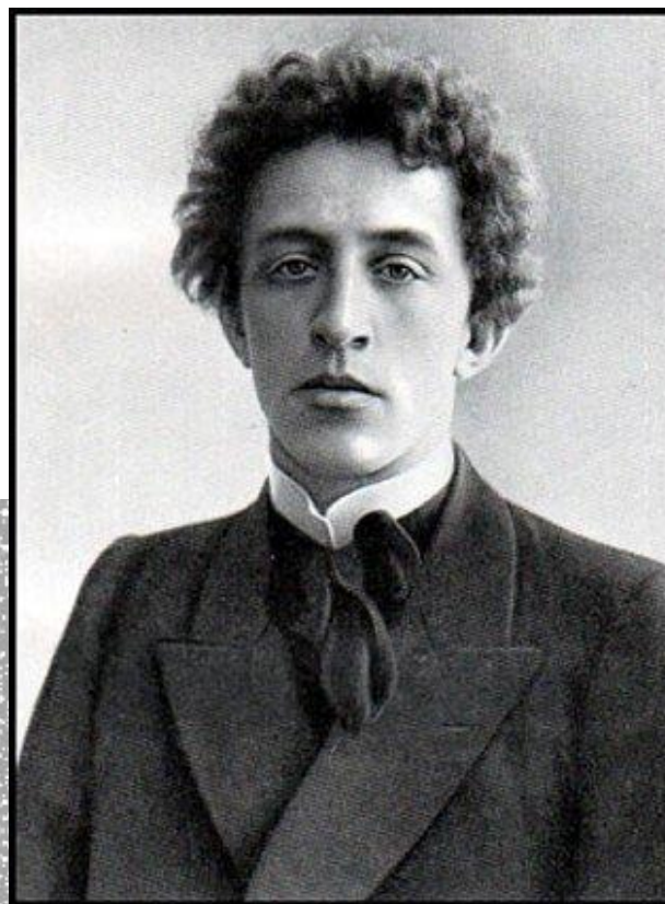
А. А. Блок.