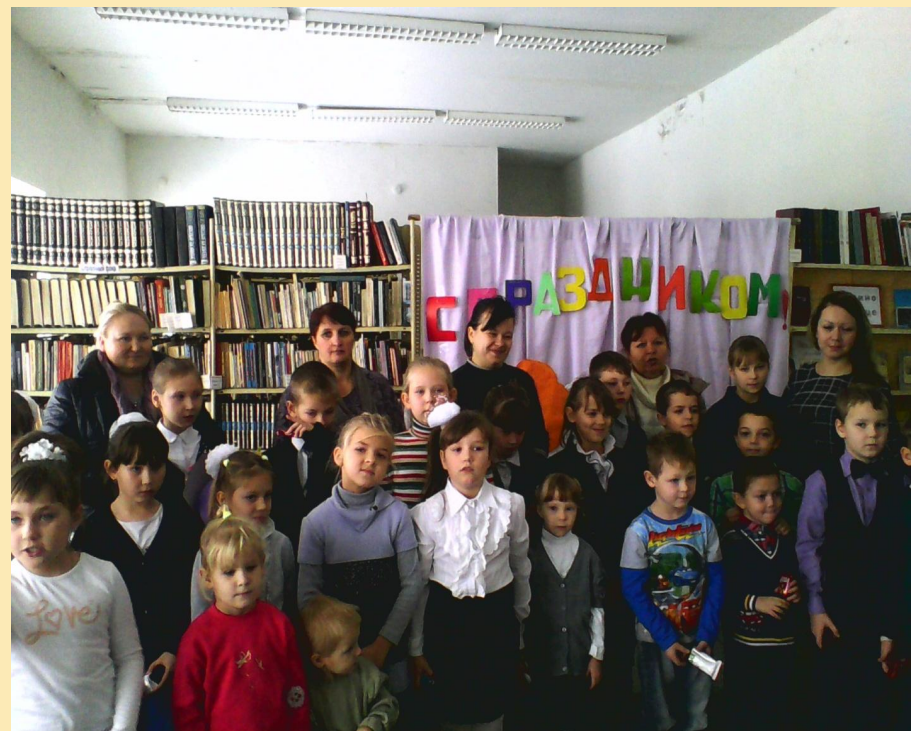
Праздник для детей