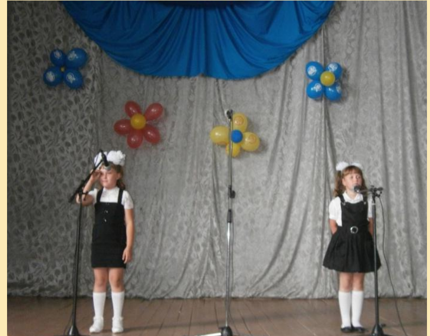
Юные участники кружка