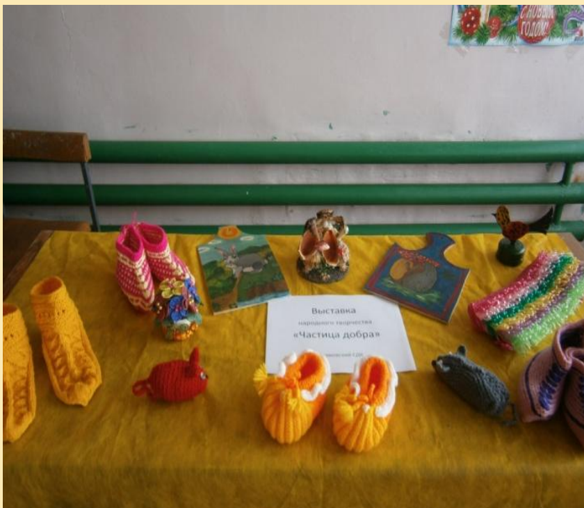
Выставка народного творчества