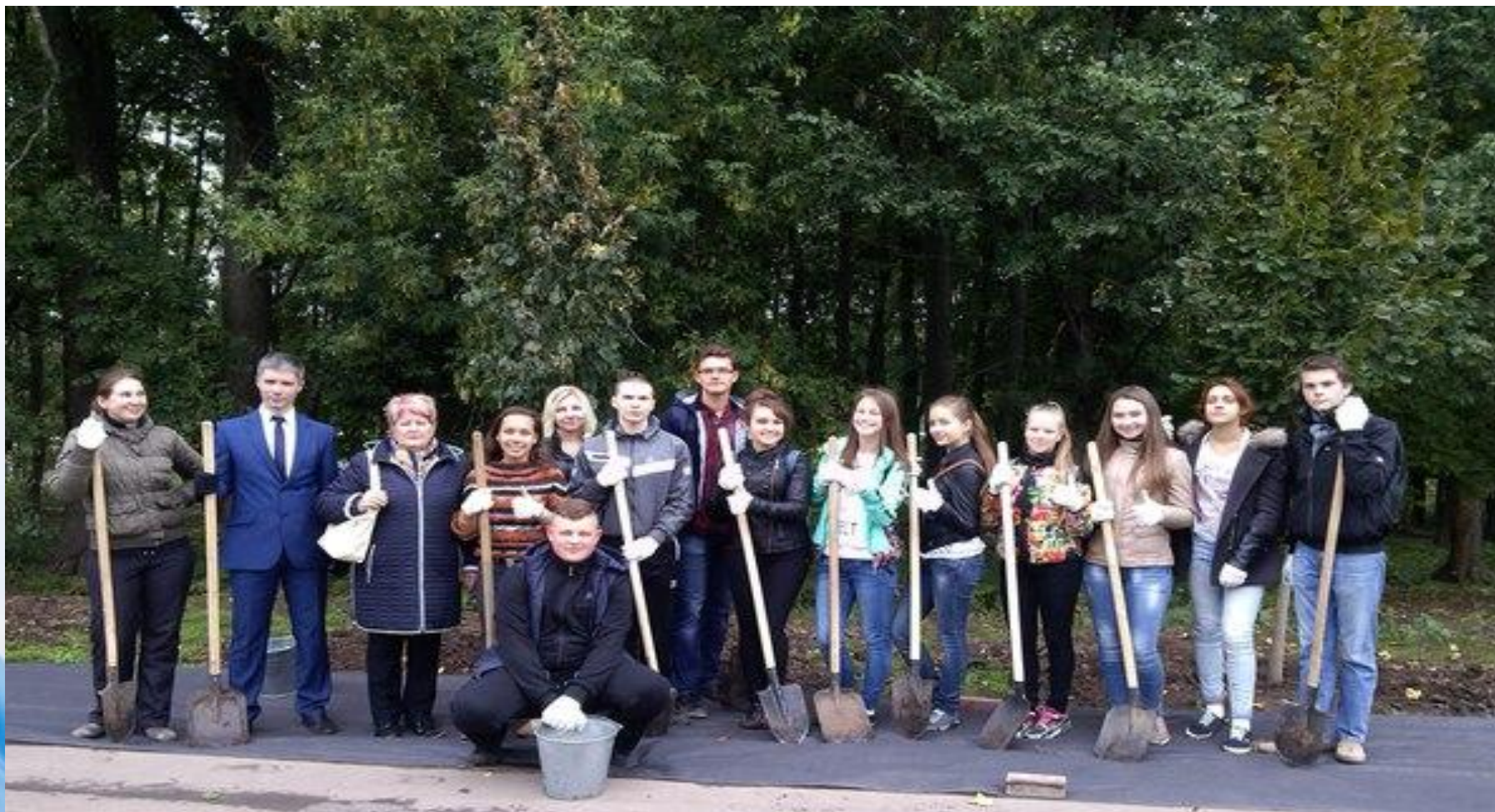
Акция «Кислород Городам» в ЦПКиО им. П.П. Белоусова