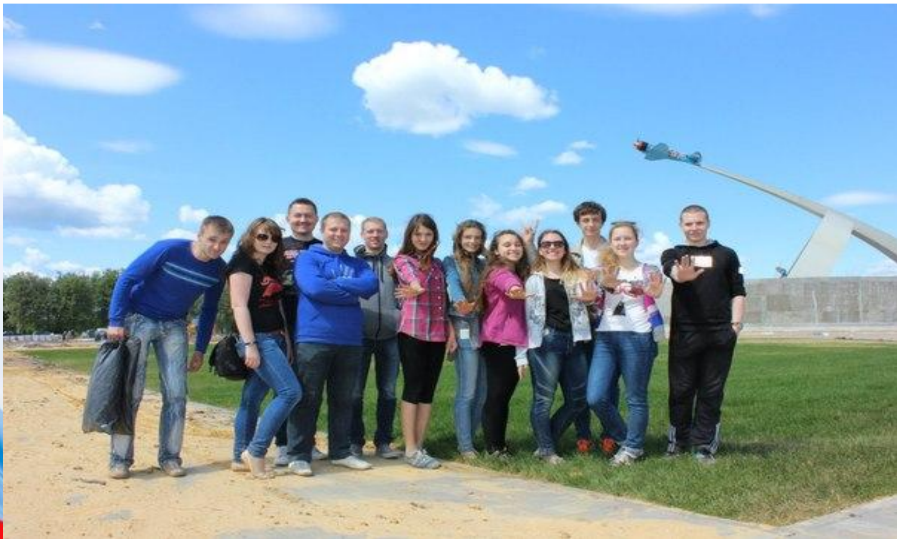
Субботник у мемориала «Защитникам неба Отечества»