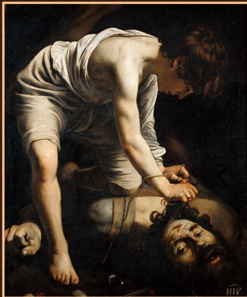
Давид и Голиаф