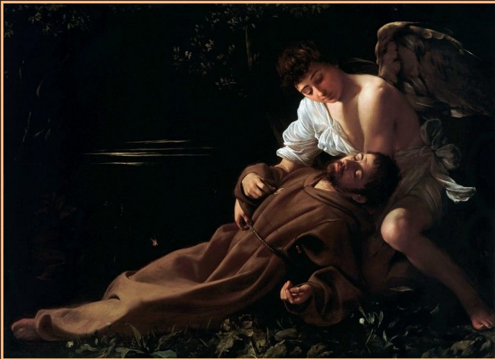
Экстаз Св. Франциска