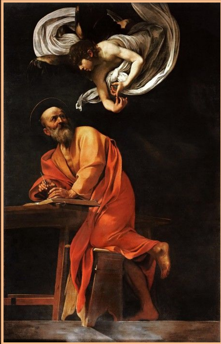
Апостол Матфей и ангел

Цикл из трех картин, посвященных жизни апостола Матфея («Апостол Матфей и ангел», «Призвание апостола Матфея», «Мученичество апостола Матфея») становится поворотным в творчестве художника. Здесь во всей полноте проявляется сила его реалистического видения. В этих картинах Караваджо по-новому активизирует роль света в живописном пространстве и пластическую моделировку персонажей