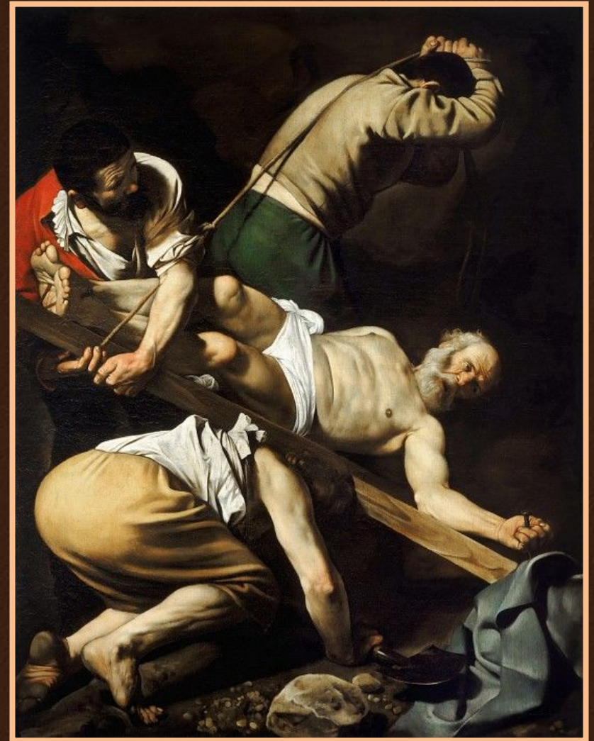
Распятие святого Петра

Параллельно Караваджо создает свои знаменитые алтарные картины для церкви Санта Мария дель Пополо в Риме – «Распятие св. Петра» и «Обращение Савла»