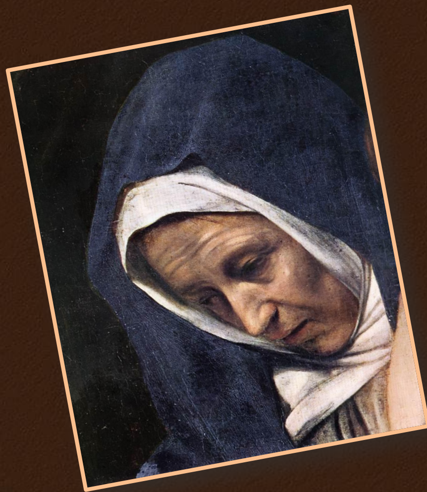
Положение во гроб