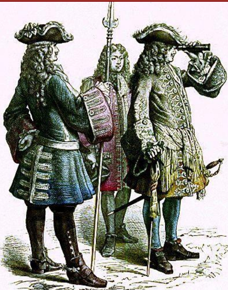
Französischer Marschall und Subaltern-Offizier.

Управление страной и в Англии и во Франции осуществляли чиновники. Должности чиновников передавались по наследству, покупались. Личные достоинства не играли роли – важно было наличие денег. Большинство чиновников не получало платы от государства, а жило за счет населения (подарки, подношения, взятки).