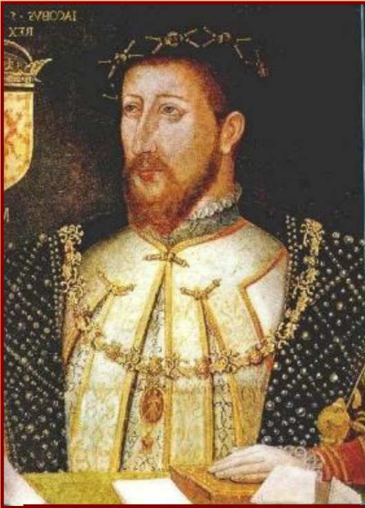
Яков I Стюарт

Вступивший на английский трон после Елизаветы Яков I Стюарт (1603-1625) в течение всего своего правления боролся с парламентом, всячески ограничивая его роль.