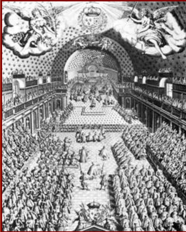
Французские Генеральные штаты в 1614 г.

В Англии центральным административным и исполнительным органом был Тайный совет, члены которого назначались королем. Во Франции при короле существовал совет, считавшийся правительством, но его члены также назначались королем и выполняли его волю. Членами этого правительства были принцы крови, высокие духовные чины, финансисты, юристы, но в стране было личное правление короля.