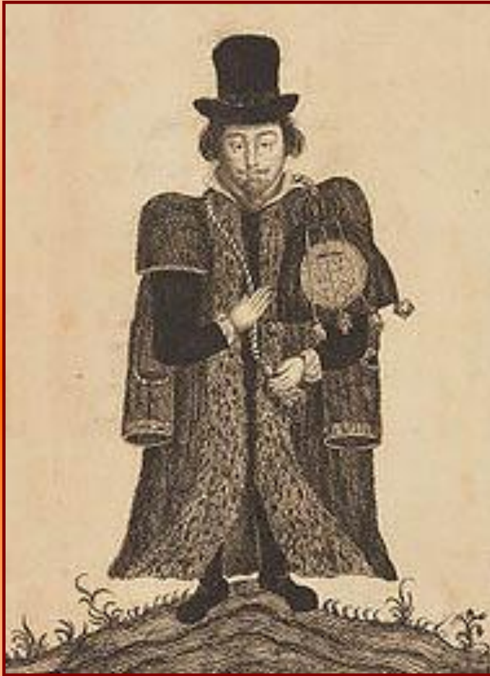
Английский юрист 16 в.

В Англии большая часть судебных дел велась двумя королевскими судами. За правосудием и мятежной знатью наблюдала Звездная палата. На местах существовали выборные мировые судьи (из старой аристократии и нового дворянства), но они избирались под контролем правительства и Тайного совета.