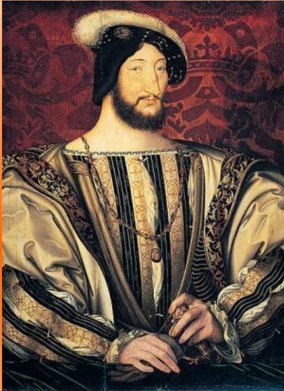
Франциск I Валуа

Во Франции абсолютная монархия начала складываться к XVI веку. Король Франциск I Валуа (1515-1547) единолично принимал все важнейшие решения, на своих указах он писал: «Ибо нам так угодно». Генеральные штаты во Франции не превратились в постоянно действующий орган, а собирались только в случае большой необходимости по решению короля. С 1614 до 1789 г. Генеральные штаты не собирались ни разу.