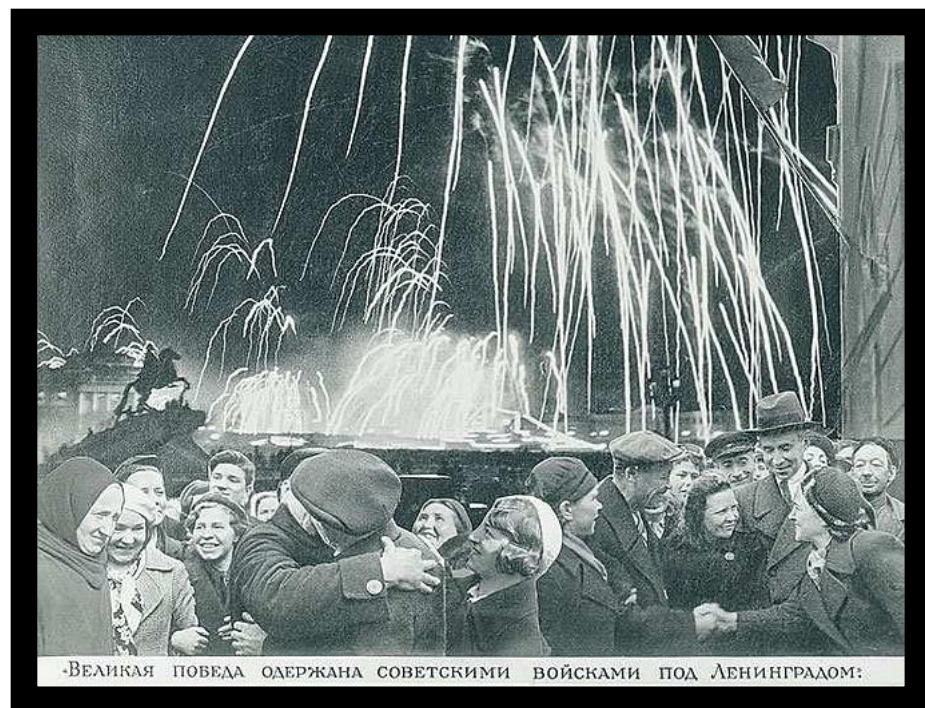
«ВЕЛИКАЯ ПОВЕДА ОДЕРЖАНА СОВЕТСКИМИ ВОЙСКАМИ ПОД ЛЕНИНГРАДОМ»