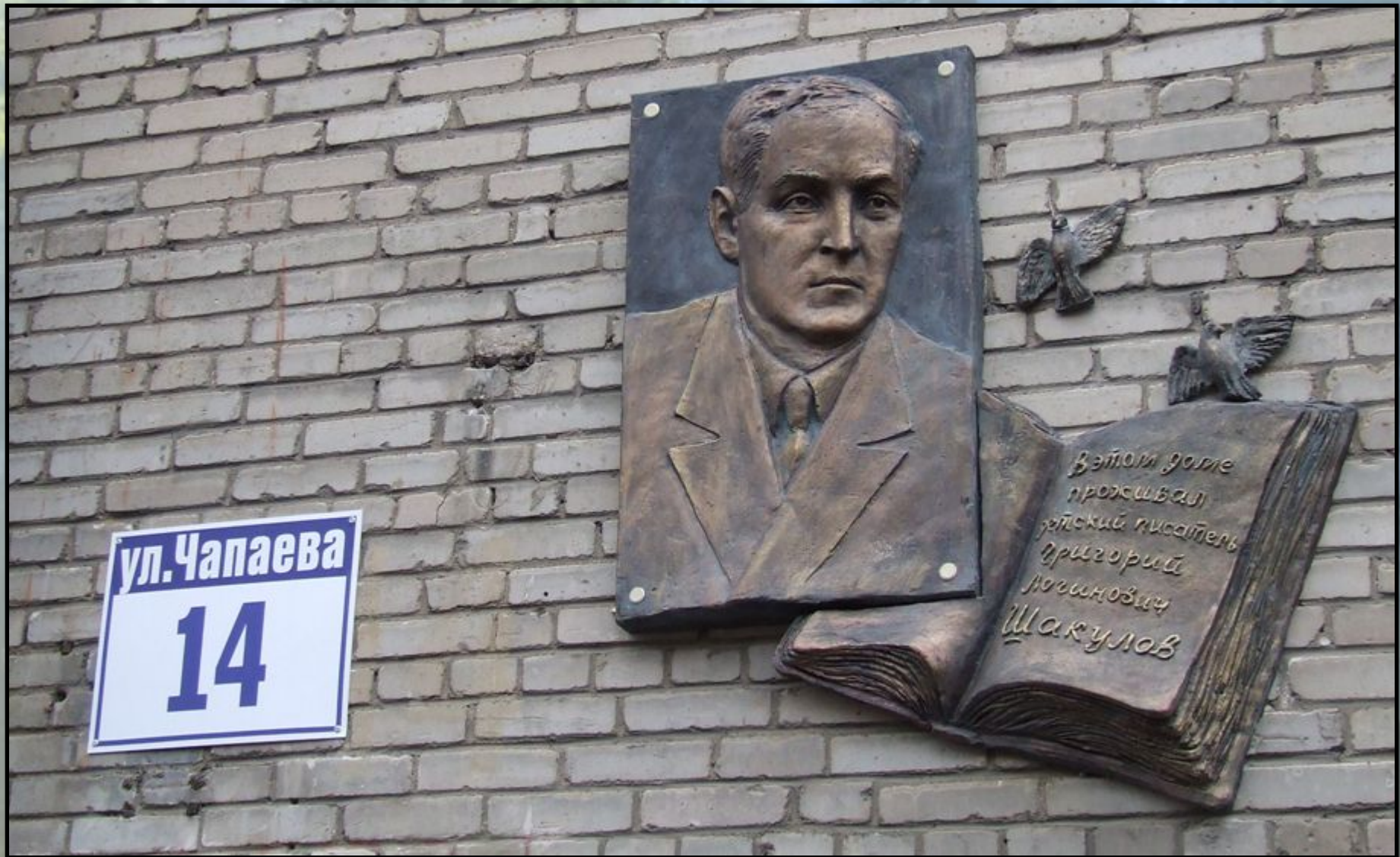
М емориальная доска Г ригорию Ш акулову в