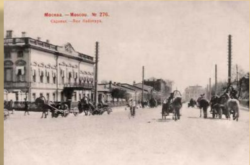
Москва, Садовое кольцо, 1903.

В 1911 по инициативе Вересаева было создано «Книгоиздательство писателей в Москве», которое он возглавлял до 1918. В эти годы выступал с литературоведческими и критическими исследованиями.