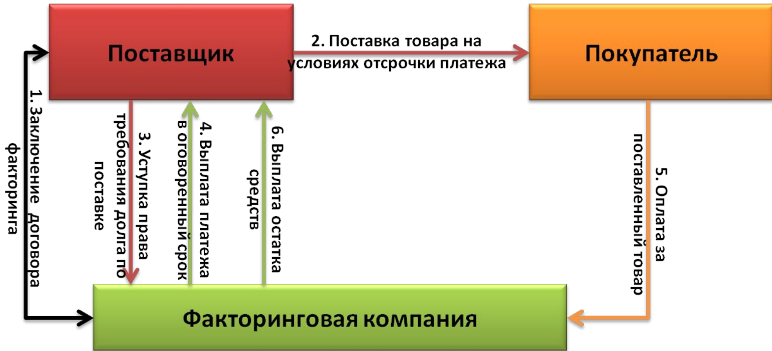
Схема факторинга (продолжение)