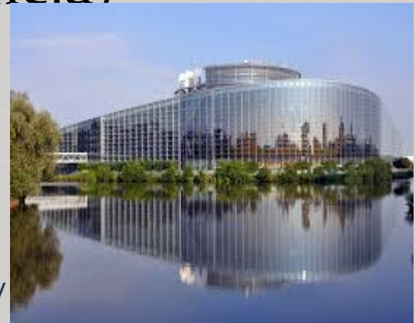
Budynek Rady Europy