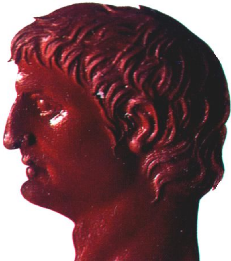
Марк Антоний. Древнеримский барельеф

Убийство Цезаря в Риме восприняли неоднозначно.