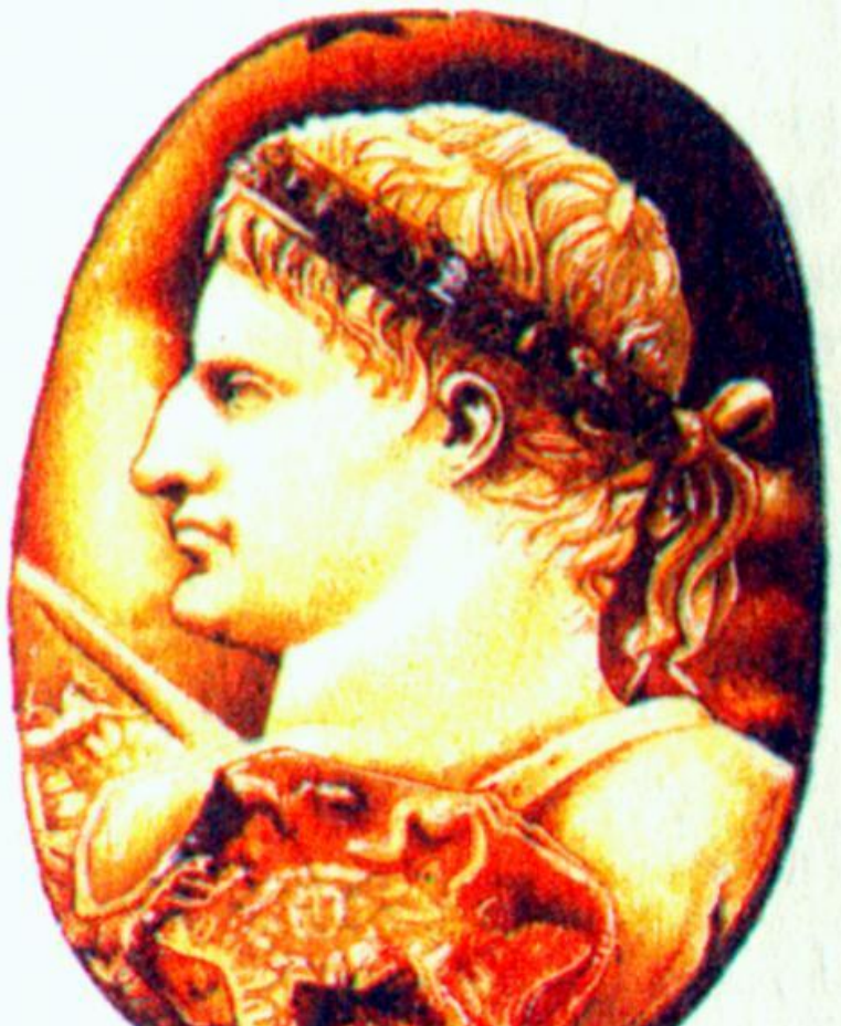
Октавиан. Древнеримская камея

Октавиан, обвинял соперника в разбазаривании земель, которые тот дарил жене и дочерям.