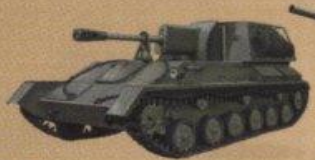
Легкая самоходная артиллерийская установка СУ-76М