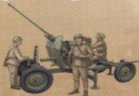
25-мм зенитная пушка (72-К) обр. 1940г.