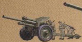
122-мм гаубица (М-30) обр. 1938г.