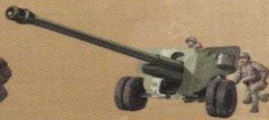
100-мм полевая пушка (БС-3) обр. 1944г.