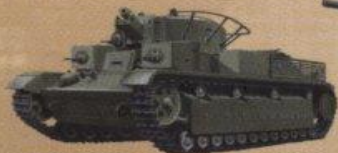
Средний танк Т-28