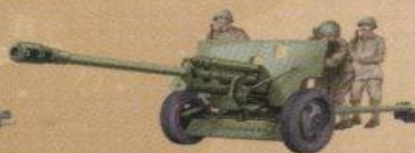
76-мм дивизионная пушка (ЗИС-3) обр. 1942г.