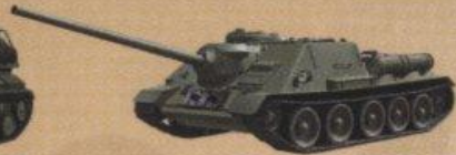
Самоходная артиллерийская установка СУ-100