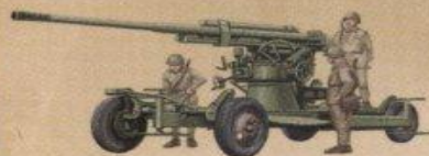
85-мм зенитная пушка (52-К) обр. 1939г.