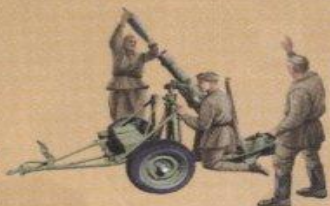
120-мм миномёт обр. 1941г.