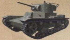
Легкий танк Т-26