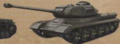
Тяжелый танк ИС-2