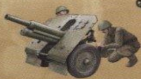
76-мм горная пушка обр. 1938г.