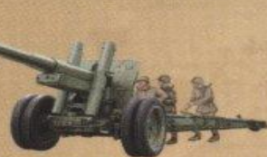
122-мм корпусная пушка обр. 1931/37гг.