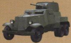
Средний броневтомобиль БА-10