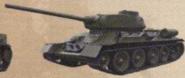
Средний танк Т-34-85