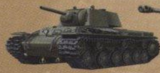
Тяжелый танк КВ-1