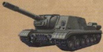
Самоходная артиллерийская установка ИСУ-152