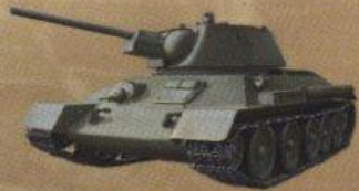
Средний танк Т-34