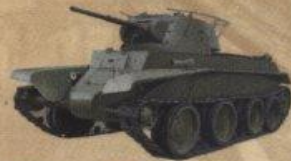
Легкий колесно-гусеничный танк БТ-7М