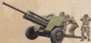
76-мм дивизионная пушка обр. 1939г.