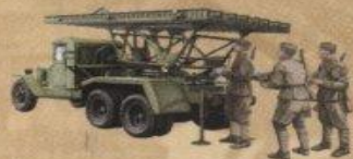
Реактивная установка БМ-13 «Катюша»