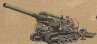
203-мм гаубица (Б-4) обр. 1931г.