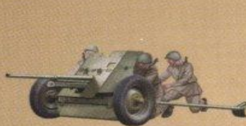
45-мм противотанковая пушка (53-К) обр. 1937г.