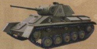
Легкий танк Т-70